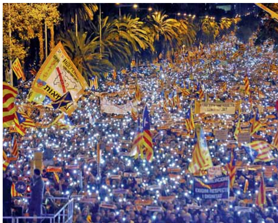
La marxa prevista a Barcelona també s'il·luminarà, com la manifestació del novembre ■ A.P.

També és un espai on s'han organitzat actes simbòlics per reclamar l'excerceració dels presos i el retorn a casa dels exi-