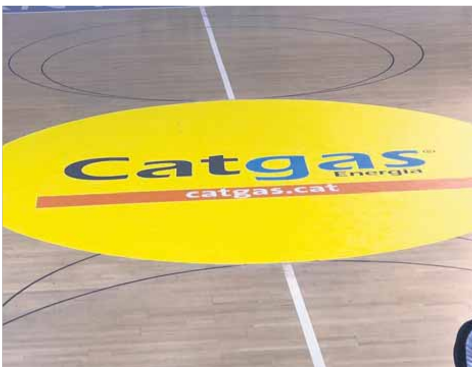
La publicitat que ha estat l'origen de la polèmica ■ CATGAS ENERGIA