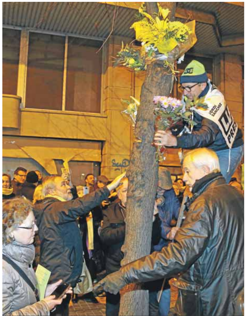
Un moment de l'acte d'ahir al vespre al carrer Provença en record de Muriel Casals

Les negociacions entre JxCat i ERC continuen marcades per les declaracions davant del Tribunal Suprem que la setmana vinent faran Marta Rovira i Marta Pascal, entre d'altres dirigents del procés. Des de la presó, el president d'Òmnium, Jordi Cuixart, va citar Muriel Casals per advertir a JxCat i ERC que no entendrien "que no es possessin d'acord". En una carta adreçada a la que va ser presidenta de l'entitat i després diputada de JxSí, que ahir feia dos anys que es va morir, Cuixart els va demanar que "assumeixin la responsabilitat que els han donat les urnes". ■