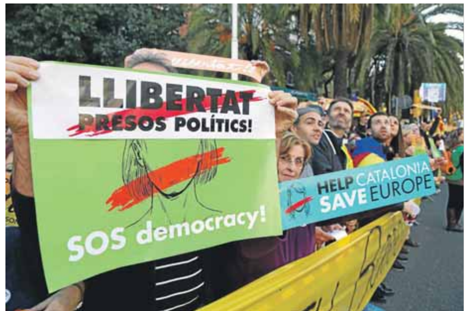
Un moment de la manifestació que es va fer el mes de novembre passat a Barcelona per reclamar la posada en llibertat dels presos polítics

Malgrat que el PDeCAT li ho va demanar, el govern de Colau no pensa demanar, per ara, una reunió de la comissió bilateral amb l'Estat per tractar dels efectes que la intervenció de la Generalitat pel 155 té sobre la ciutat. La qüestió amoïna, però l'executiu local té vies de diàleg obertes amb l'equip de Rajoy que han permès desencallar, per exemple, la Sagrera.