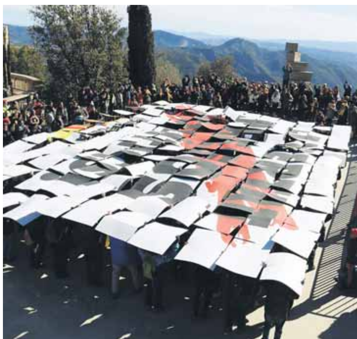
El mosaic a Montserrat reclamant la llibertat dels presos polítics

En vista del fet que la repressió va en augment, la nostra resposta no pot ser assumir-la i adoptar-la com a inevitable. I menys encara adoptar la postura de recular per sistema. Si dignament podem afirmar i provar que el nostre de-