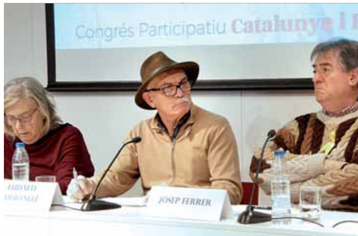
Membres del consell directiu del Congrés Participatiu Catalunya i Futur, durant els debats de presentació de l'esdeveniment