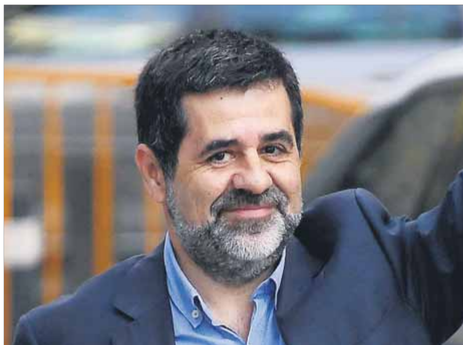
El diputat de JxCat Jordi Sánchez, en una imatge del mes d'octubre passat