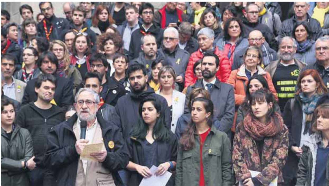
En Peu de Pau va organitzar ahir un acte a la plaça del Rei, amb la presència del president Roger Torrent

ACTE • El magistrat obvia l'ONU i torna a negar a Jordi Sànchez el dret a assistir al ple