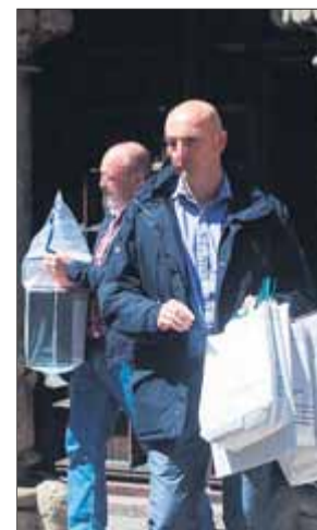
Dos guàrdies civils ahir a la sortida de la seu del Diplocat, a Barcelona

Una desena d'agents va irrompre a l'edifici, situat a la Casa de les Punxes de Barcelona, per ordre del jutjat d'instrucció número 13, que investiga els preparatius del referèndum de l'1-O, a la recerca de documentació relacionada amb la contractació d'observadors internacionals