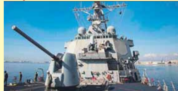
El destructor 'USS Donald Cook' sortint de Xipre