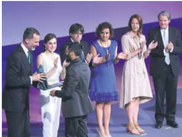
L'entrega de premis de l'any passat

La Fundació Princesa de Girona (FPdGi) insisteix que celebrarà com cada any l'entrega dels seus premis amb la presència dels reis espanyols al juny a Girona, tot i l'oposició de l'Ajuntament de la ciutat a cedir-los els espais municipals habituals. Fonts de la fundació no van voler fer públics ahir "ni la data ni el lloc exacte" de l'esdeveniment, però en un comunicat de premsa han reafirmat que els guardons es lliuraran a finals de juny en una cerimònia que presidiran els reis Felip VI i Letícia a Girona. Els pre-