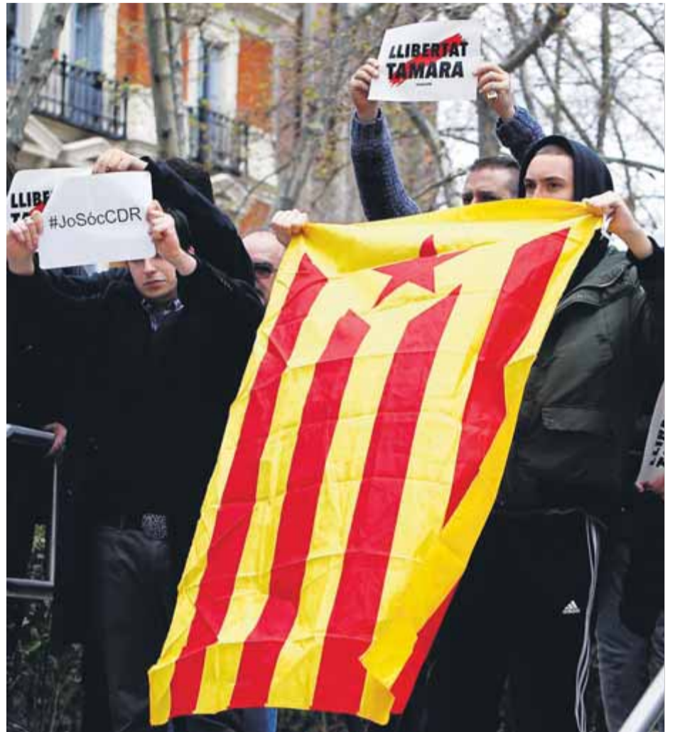
Concentrats en suport de la veïna de Viladecans, ahir a l'Audiència Nacional