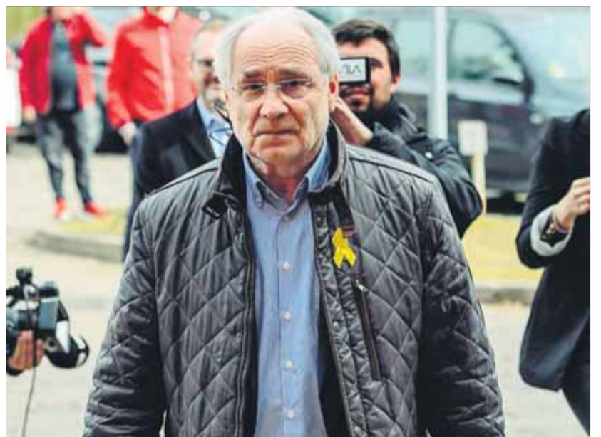
L'eurodiputat liberal Ivo Vajgl sortint de la presó de Neumünster

Va tenir algun problema per accedir a la presó?