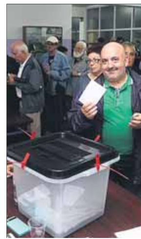
Votants en el referèndum de l'1-O en un institut de Barcelona

El jutge ja té imputats un sotsinspector i el cap de la comissaria de Santa Perpètua de Mogoda i un di-