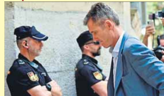
Urdangarin, als jutjats de Palma