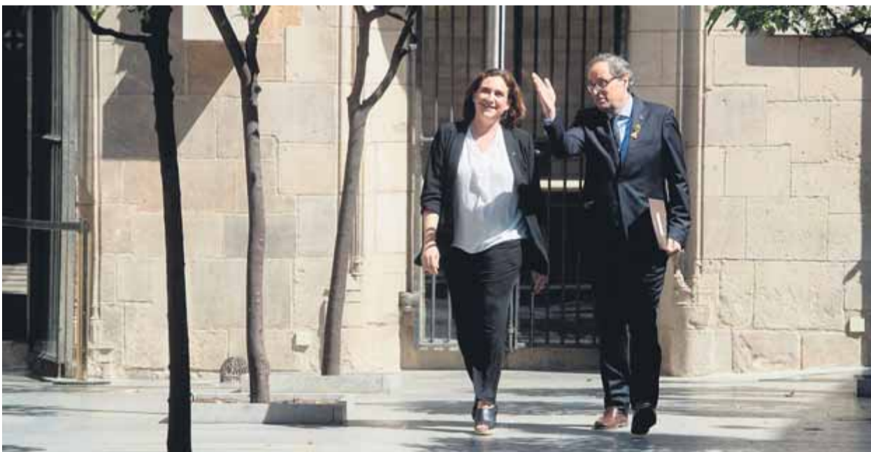
L'alcaldesa Colau i el president Torra travessen el pati dels Tarongers durant la trobada d'ahir

CÀRRECS • En una vista al Suprem insisteix a acusar els líders catalans de rebel·lió "anunciada", malversació i desobediència