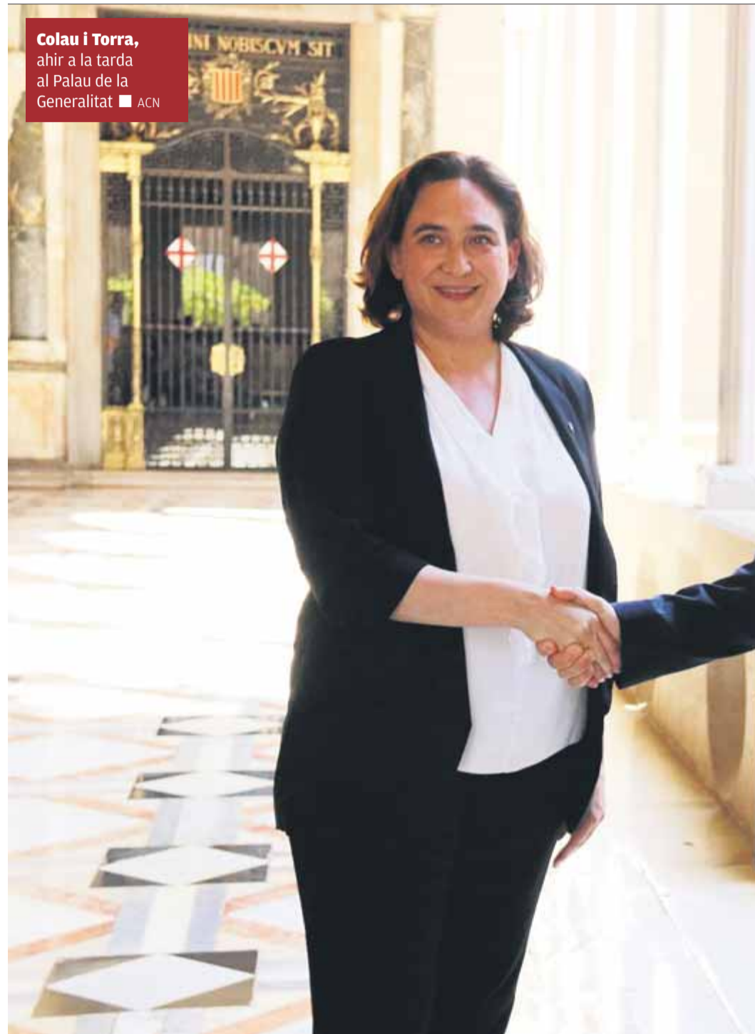
Colau i Torra, ahir a la tarda al Palau de la Generalitat

L'habitatge va ser un altre tema destacat a tractar, en què Colau va aprofitar per recordar que tot i que l'Ajuntament té una participació minoritària –del 40%– en el consorci