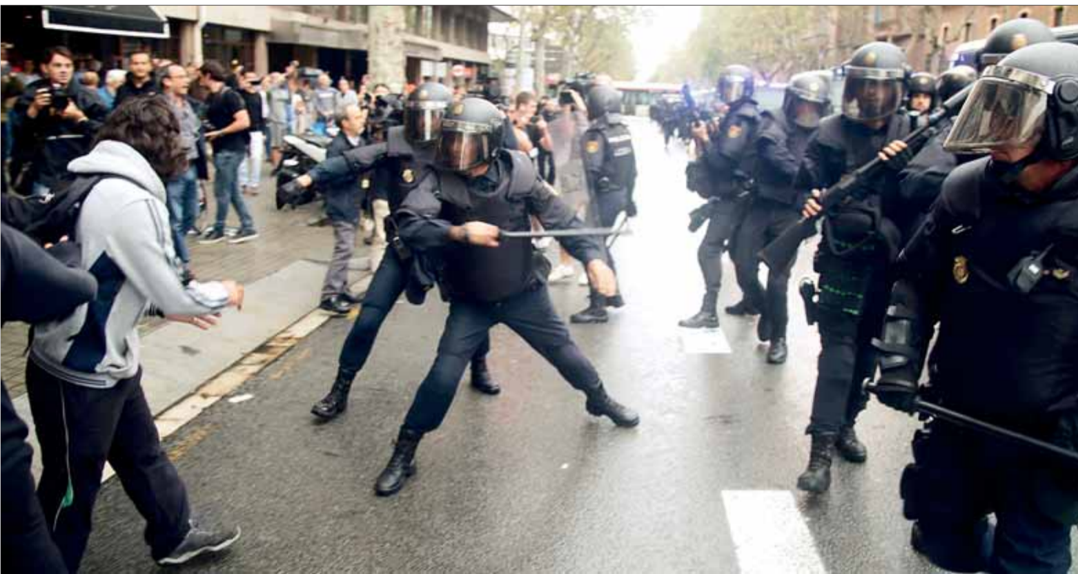
Agents de la policia espanyola, a cops de porra amb veïns durant la celebració del referèndum a Barcelona, l'1 d'octubre del 2017