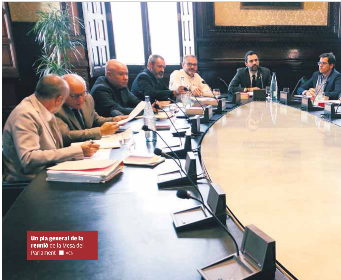
Un pla general de la reunió de la Mesa del Parlament

Els serveis jurídics ja havien comunicat a la mesa que la delegació de vot no s'adequava a la interlocutòria judicial i, per tant, no hi donaven el vistiplau, si bé eren opinions que no són vinculants, com tampoc ho és l'informe d'ahir, que les ratifica. Es desconeix quin ús en vol fer el president Torrent de cara a finalitzar avui el debat de política general amb les