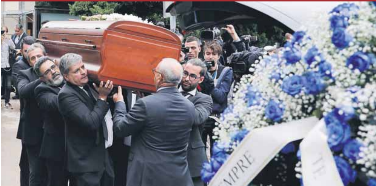
El fèretre amb les despulles de Montserrat Caballé, acabada la cerimònia d'ahir a Barcelona