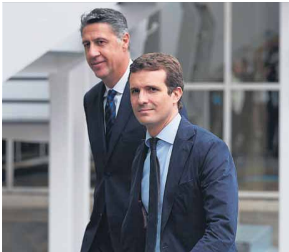
Xavier García Albiol i Pablo Casado, arribant a la reunió del comitè de direcció ahir a Barcelona

Els populars obren ara un procés de primàries que