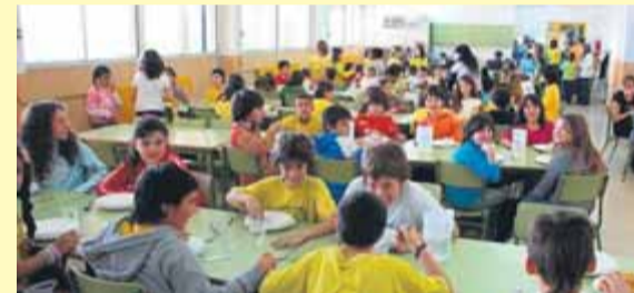
Un menjador escolar a Reus ■ A. REUS