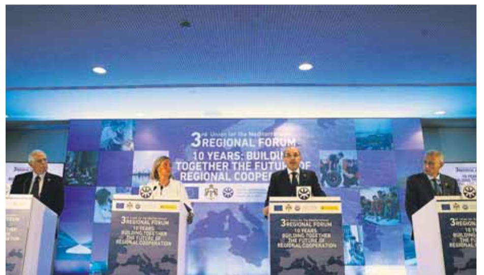
Josep Borrell, a l'esquerra, durant la celebració del fòrum ahir a Barcelona

agitadors del carrer". "Si fa tot això, no pot esperar que se'l convidi a un acte protocol·lari on, per raons merament protocol·làries, la seva presència no és imprescindible", va concloure. Segons Borrell, l'expresident Carles Puigdemont va assistir a l'última reunió perquè es va convidar ell mateix. ■