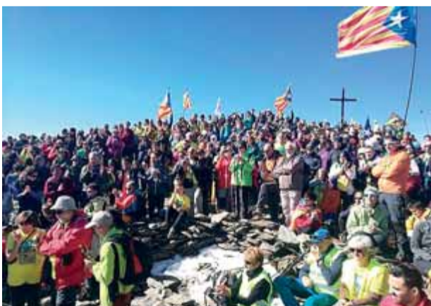
Els participants, al cim del Puigmal ■ CIMS PER LA LLIBERTAT

EL PUNT AVUI+ TELEVISIÓ Podeu veure l'entrevista sencera, avui, a El Punt Avui TV A les 10.00, a les 17.00 i a les 23.30 h