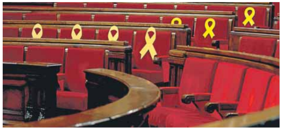
Llaços grocs al Parlament en record dels presos polítics i els exiliats ■ EFE

■ Filtren que la fiscalia demanarà “penes mínimes” pel delicte de rebel·lió ■ El PDeCAT supedita la negociació del pressupost amb Pedro Sánchez a “un canvi d'ordres”