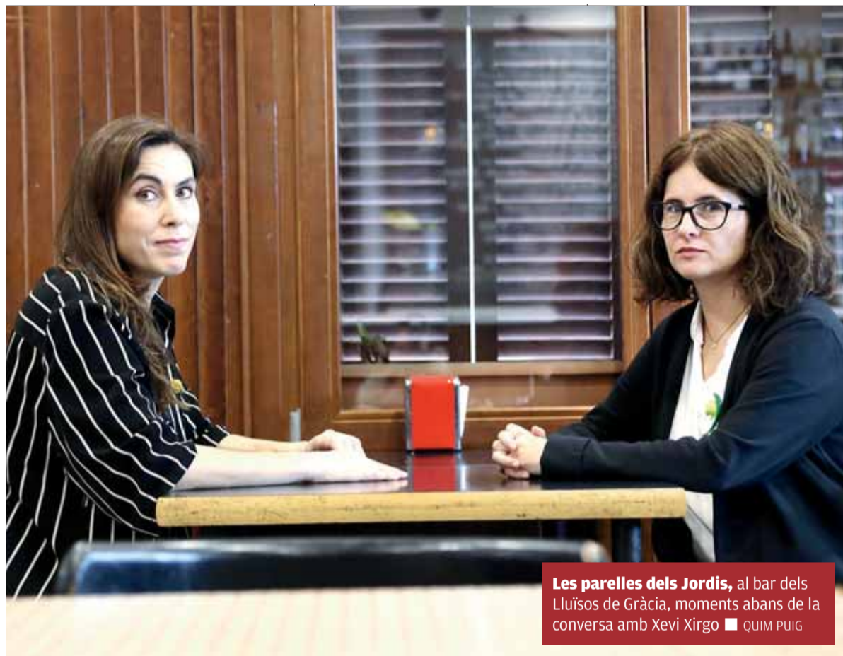
Les parelles dels Jordis, al bar dels Lluïsos de Gràcia, moments abans de la conversa amb Xevi Xirgo ■ QUIM PUIG