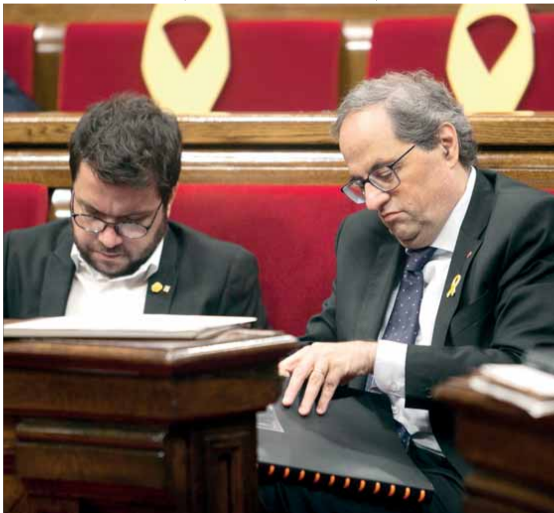
El president Torra i el vicepresident Aragonès, en una imatge del ple de la setmana passada

D'acusacions d'haver trencat pactes, de fet, n'hi ha hagut en els dos sentits. ERC, com els comuns, retreu a JxCat que s'hagi carregat el que va votar el ple dimarts, que van estar intentant pactar durant dos mesos, ja que no es va acollir al mecanisme previst en el segon punt perquè els diputats designessin el vot, per bé que el mateix redactat deia que era potestatiu. JxCat, en canvi, s'aferra al primer punt d'aquell acord –que ERC entén més com un rebuig polític que no pas efectiu–, que diu que, si la suspensió no és vàlida, els seus diputats poden seguir delegant el vot com feien fins ara. Això, de fet, havia sortit en les converses prèvies, assegura ERC, però es va descartar. El dia 4 al migdia, com a mal menor veient que tornaven a trencar, els republicans ho van acceptar a mitges, però el demolidor informe dels lletrats els va donar la coartada per deixar-lo dimarts passat en paper mullat, ja que deia clarament que els vots no es podien continuar delegant després de la interlocutòria de Llarena. El PSC va donar a ERC el vot que necessitaven a la mesa i Cs, l'abstenció. No va ser una estratègia pre-