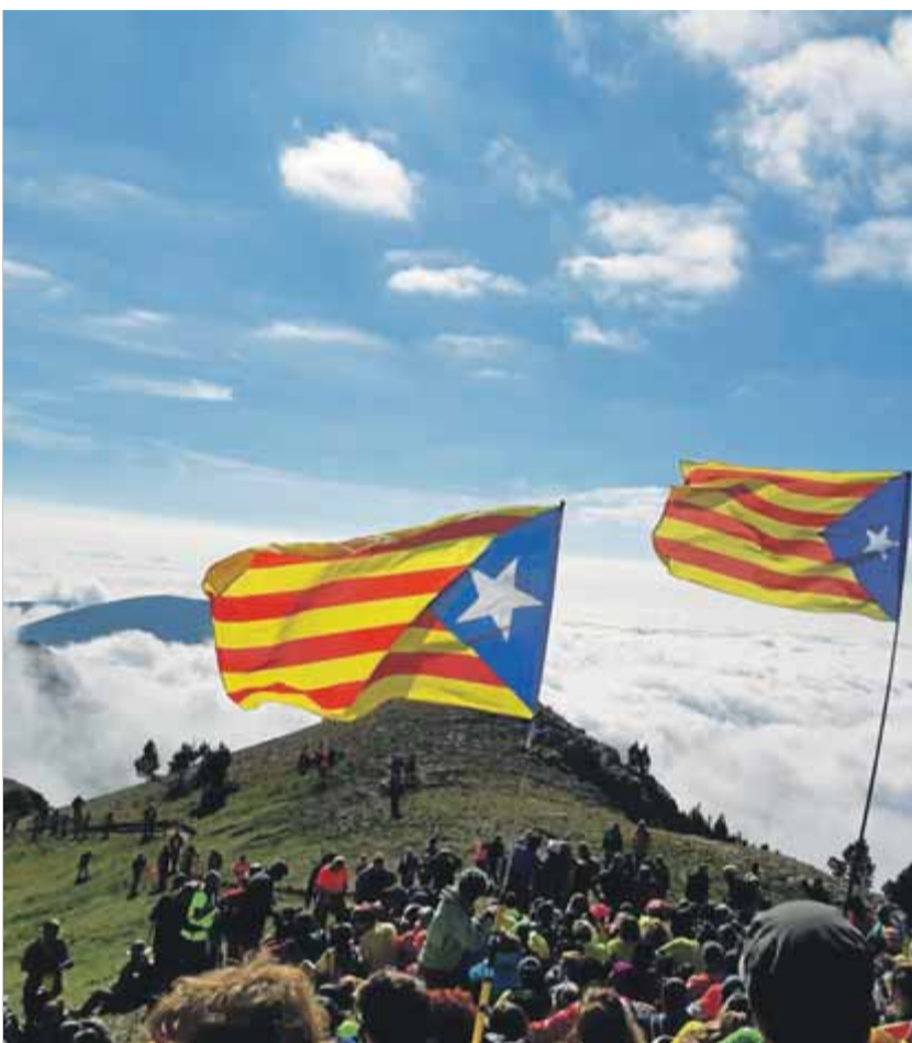
Diversos instants als cims de la Gallina Pelada (triat per Anna Gabriel), de Sant Jeroni (Oriol Junqueras), Puigsacalm (Puigdemont), Roca Corbatera (Raül Romeva), Pedraforca (Meritxell Borràs) i Canigó (Jordi Cuixart). Familiars de Dolors Bassa, amb fotos dels empresonats i exiliats, al castell del Montgrí