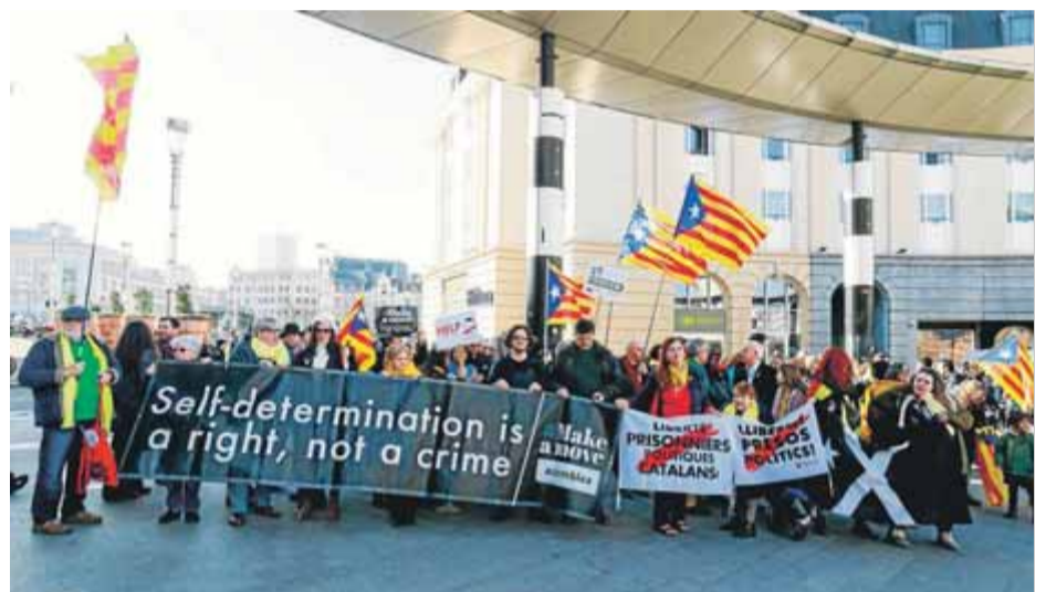
Imatges de les protestes d'ahir a Sant Sebastià i Brussel·les

ODONTOLOGIA D'ALTA QUALITAT LABORATORI PROPI