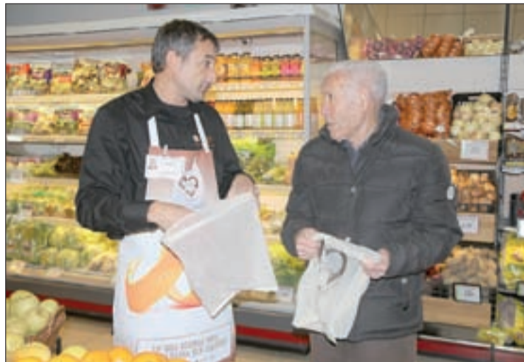
Un home informa a un client de la campanya

Aquest projecte no ha suposat cap cost afegit per al ciutadà. Els establiments comercials de la Seu