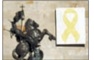
El Pati dels Tarongers

Torra acepta retirar el lazo pero busca otro símbolo alternativo