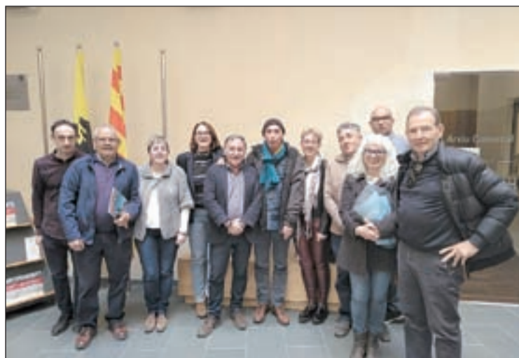
El cantautor Lluís Llach, ahir a Tremp

Lluís Llach es va reunir ahir amb els alcaldes i consellers del Consell Comarcal del Pallars Jussà en qualitat de President del Consell Assessor per a l'impuls d'un Fòrum Cívic i Social per al Debat Constituent. Aquest espai, que actuarà com a instrument de cohesió social, comptarà amb la participació de la ciutadania.