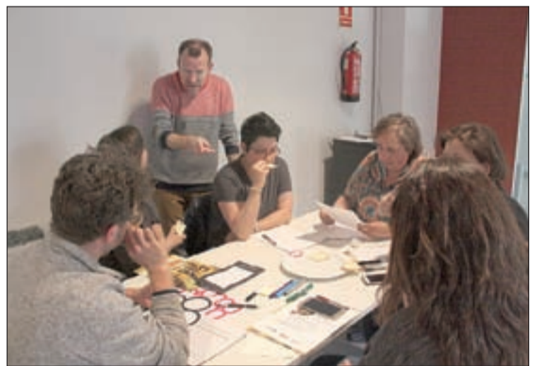
Imatge de la jornada tècnica celebrada ahir

se'n fa càrrec el punt de venda. Els Ajuntaments de la comarca s'han compromès a tenir obertes i en bon estat les quinze àrees de barbacoes per recuperar la tradició de fer carn a la brasa. En l'edició de l'any passat d'aquesta festa, la carn de venda de carn de corder es va triplicar. Les carnisseries del Jussà esperen aconseguir els mateixos resultats aquest any.