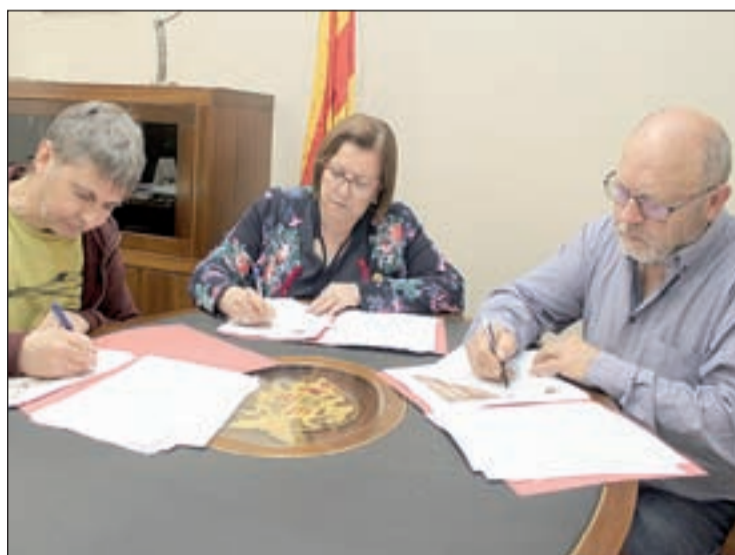
Moment en què es va signar ahir el conveni

L'acte de signatura va tenir lloc a la Casa Consistorial de la capital de l'Urgell. Els elements cedits