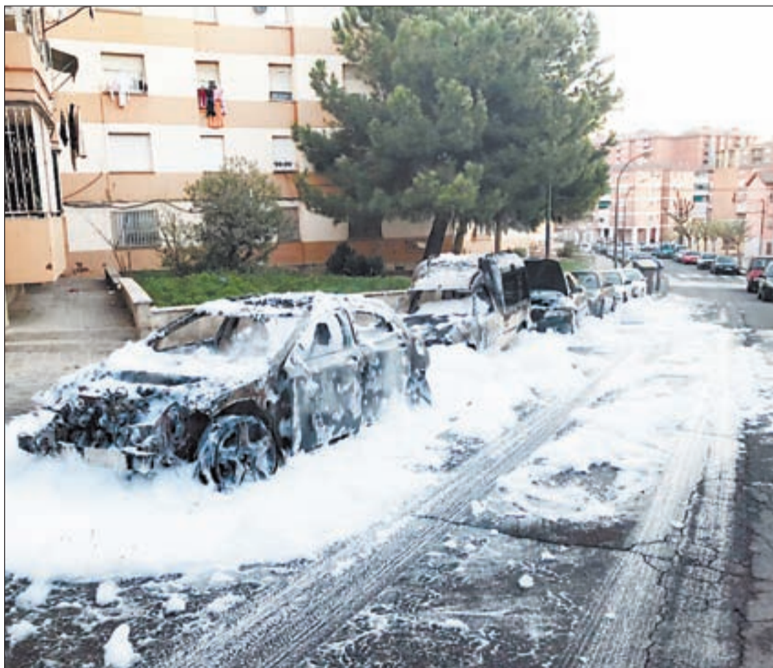
Dos coches quedaron calcinados la madrugada de ayer y otros siete se vieron afectados