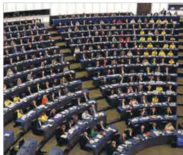
Eurodeputats a la cambra del Parlament Europeu, alguns dels quals amb samarreta groga solidària