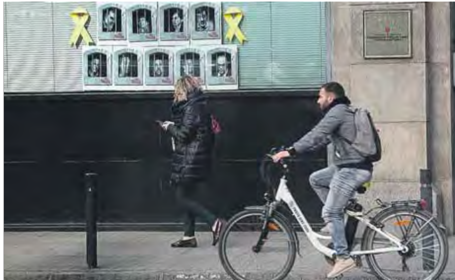
Llaços grocs i la cara dels presos polítics, ahir a la conselleria de Polítiques Digitals ■ J. LOSADA

grés i candidat a les eleccions espanyoles del 28 d'abril per Toledo, Juan Carlos Girauta, va aprofitar aquest fet per advertir des de la plaça de Sant Jaume el president Quim Torra que estaven estudiant presentar "una denúncia a la fiscalia, al jutjat de guàrdia o una querrela" si no complia el requeriment de