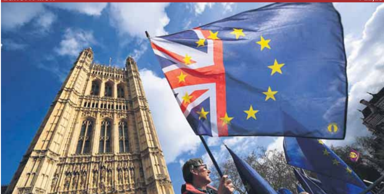
Manifestants proeuropeus, ahir davant del Parlament britànic