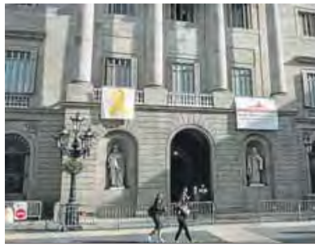
El llaç groc a l'ajuntament ■ JOSEP LOSADA

L'ens electoral havia donat 12 hores a l'alcaldeessa perquè retirés el símbol de la façana