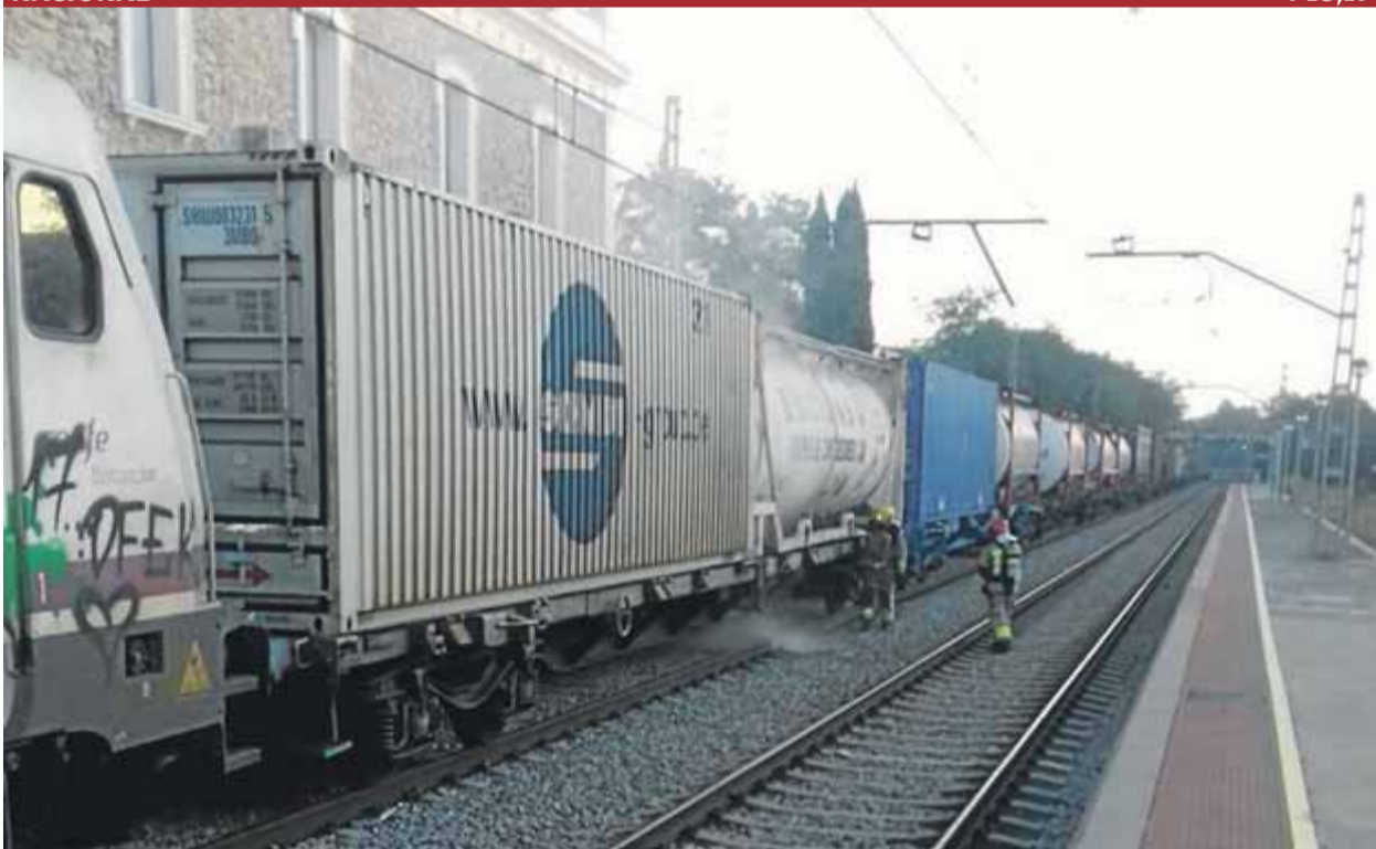
La fuga en un vagó del tren, a la foto, aturat a Riudellots, va afectar també l'R1 i el trànsit a la C-25 ■ BOMBERS

TENS • Malestar pel pacte, que tensa més la relació entre els dos socis independentistes del govern