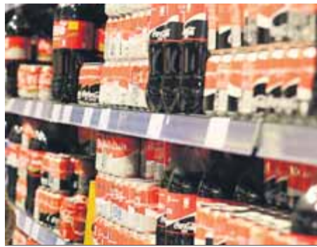
Begudes ensucrades en un súper ■ J.R.

El TSJC anul·la el reglament però el govern insisteix que la taxa es continuarà cobrant