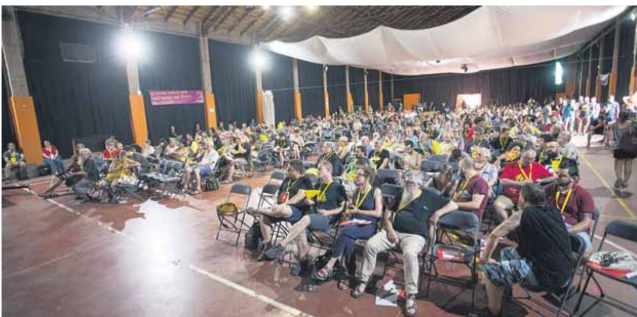
Aspecte de l'assemblea nacional que la CUP va celebrar ahir a Celrà

"No hem fet front comú contra Ballesteros"