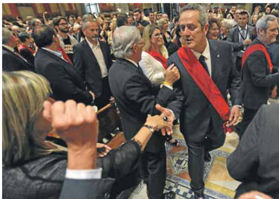
Forn no podrà repetir aquesta imatge del dia de la constitució de l'Ajuntament

La importància o no d'aquest vot depenia ahir al vespre de les negociacions que el govern i l'oposició mantenien per tractar d'arribar a un acord i que en el moment de tancar aquesta edició encara no havien prosperat ni en un sentit ni en un altre. Les posicions es van acostar una mica en una primera trobada divendres