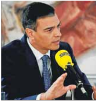
Pedro Sánchez, ahir

Acusa el líder d'UP de convocar una consulta "trucada" a les seves bases per justificar el no a la investidura