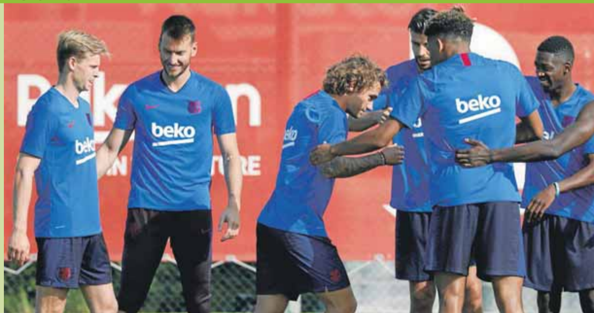
Griezmann, Neto i De Jong, a punt de rebre "l'estrena" dels seus nous companys de vestidor