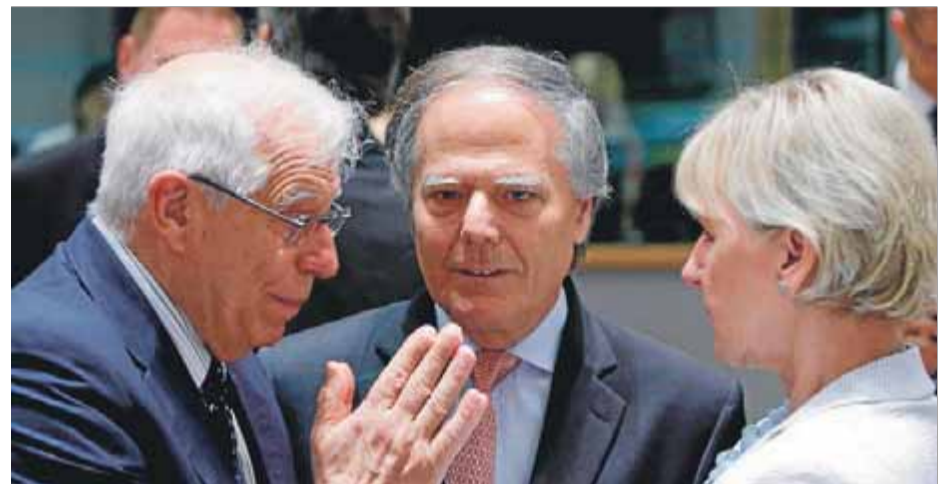
Josep Borrell, amb altres ministres d'Afers Estrangers, ahir a Brussel·les

La diputada de la CUP Natàlia Sánchez, en una entrevista El Punt Avui, va explicar ahir el nou cicle polític que per a l'esquerra independentista suposa aquest nou context de reformes, en què buscaran teixir noves aliances sobretot amb tots aquells ciutadans que "estan cansats d'ambigüitats", en referència als comuns i també JxCat i ERC. La renovació ha de ser validada el dia 28 per la militància. Sobirania i resposta social seran els principals eixos de treball amb un focus en una prestació de serveis 100% pública, democratitzada i transparent que ara veuen amenaçada amb la llei Aragonès que permetria, diuen, "externalitzar" serveis com la cura a les persones grans. "Som quatre diputades, però més determinants que abans per poder construir sobirania i agenda social si JxCat i ERC ho volen", afirmava. ■