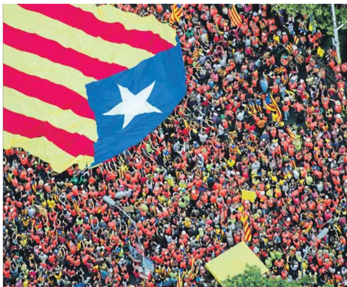
Imatge aèria de la manifestació de la Diada de l'any passat

I ara que tenim al davant un nou Onze de Setembre, neixen iniciatives diverses que voldrien tornar-nos a portar a aquell moment, i fer allò que no vam fer aleshores: aquell "Maidan" per defensar la declaració d'independència.