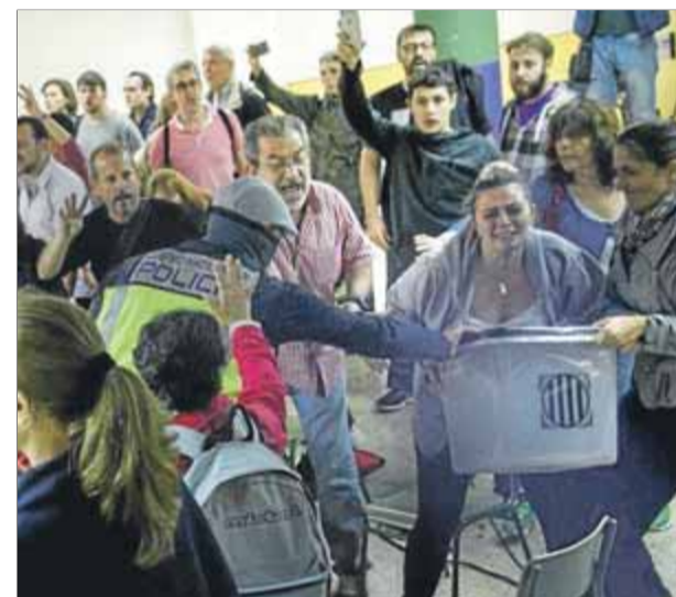
L'Audiència diu que la policia va usar malament la força contra els votants de l'institut Pau Claris l'1-0 ■ A.M.

■ L'Audiència de Barcelona desestima un recurs policial i retreu al cos que usés la força sense esgotar el diàleg