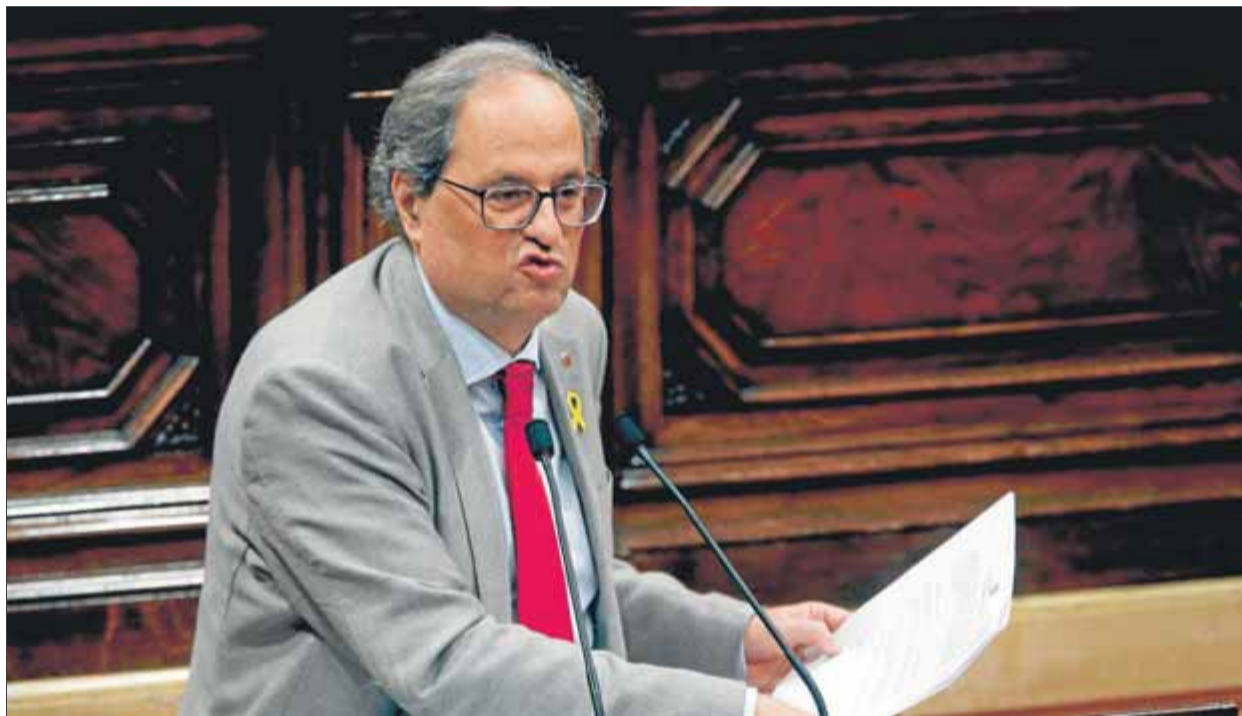
El president, Quim Torra, durant una intervenció ahir des de la tribuna al ple del Parlament

El Parlament aprovarà avui una proposta de resolució presentada conjuntament per JxCat, ERC i la CUP, i pactada també en els últims dies amb els comuns, que es ratifica en la "defensa de l'exercici del dret a l'autodeterminació com a instrument d'accés a la sobirania del conjunt del poble de Catalunya". El text, que es presenta com a conclusió al debat monogràfic sobre la "Catalunya real" que es va fer ahir, es referma així en la "recerca de solucions democràtiques i polítiques" per fer efectiu que el futur "sigui el que el poble de Catalunya vulgui". A més, insisteix a exigir "l'alliberament immediat" dels presos polítics, i subratlla la necessitat del "respecte escrupolós dels drets civils i polítics" de la societat catalana. La moció es complementa amb una altra proposta conjunta de JxCat i ERC (que en presenten 16 en total) que insta el govern a "perseverar en el diàleg i la negociació per fer efectiva la voluntat de la ciutadania i trobar sempre solucions democràtiques", i que alhora demana a l'executiu que treballi "per obtenir les eines pròpies d'un es-