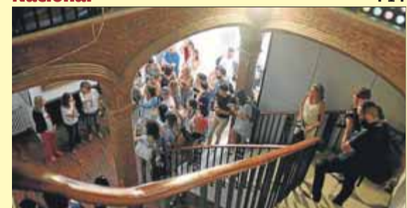
Els periodistes i tècnics al centre, a Collserola