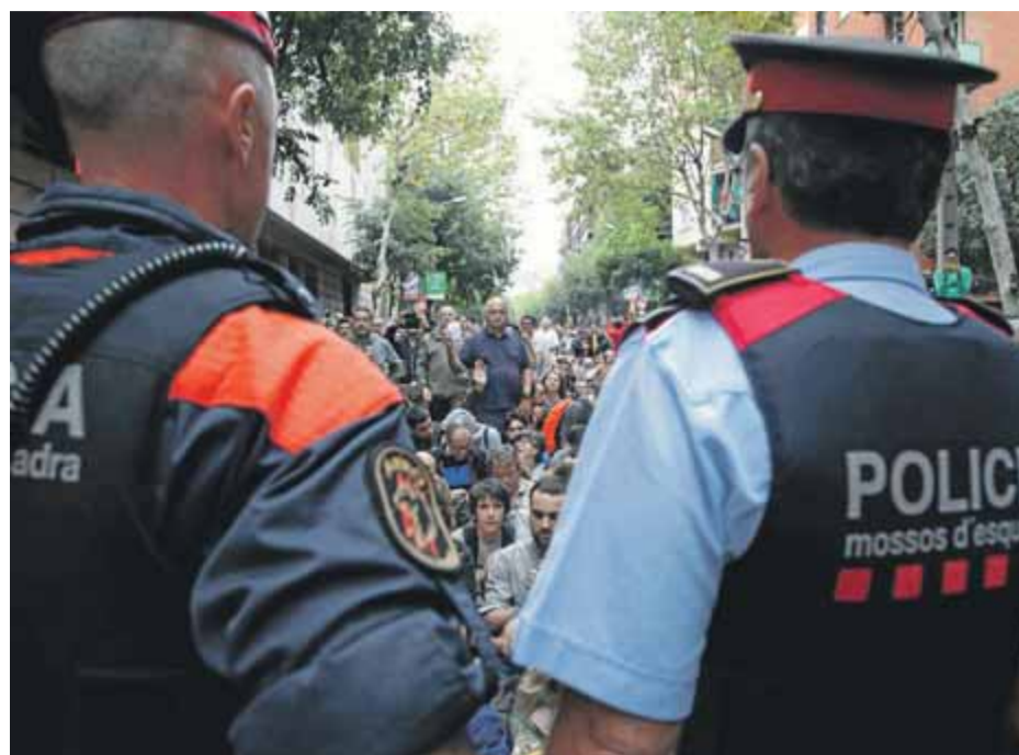
Agents dels Mossos, durant el referèndum de l'1-O del 2017

Segons el diari, i malgrat no tenir res a veure amb el cas de la instrucció judicial, tenen molta documentació i fonts d'antics dispositius policials que certifiquen la sortida de diners sota l'epígraf de Mossos per pagar aquests confidents. A més, també informen que ha desclassificat abonaments per valor de 40.000 euros fins al 2015 relacionats amb els dispositius de seguiments policials a agents dels Mossos que, segons Interior,