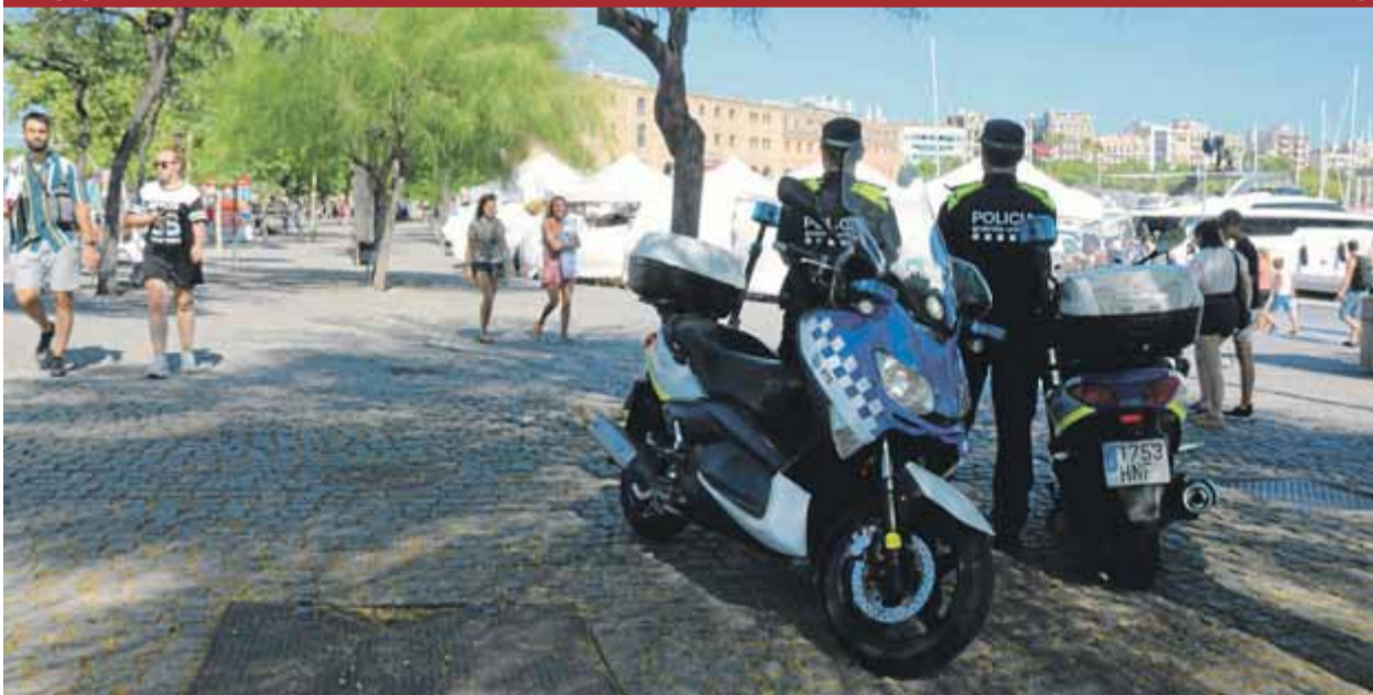
Dos guàrdies urbans, a la zona del moll del dipòsit, fins ara ocupat pels manters, ahir a la tarda