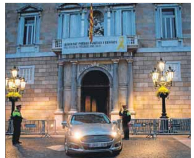
El cartell amb el llaç groc al balcó de la Generalitat va ser el motiu d'una de les tres multes de la JEC

Torra manté l'opinió que motiva les sancions de la JEC: "Em reitero que el 155 va ser nefast, i que sí, hi ha presos i exiliats." Dues de les multes són per la carta enviada als funcionaris per Sant Jordi i el discurs en què va qualificar de "nefast" l'article 155 i va recordar els "presos i exiliats polítics". En el cas de desobediència per mantenir el llaç groc, la fiscalia de Catalunya demana un any i vuit mesos d'inhabilitació i 80.000 euros de multa a Torra. ■