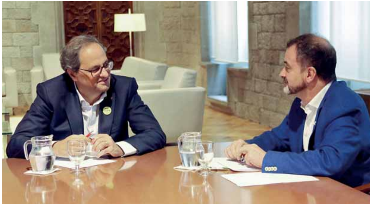
El president Torra i el conseller Bosch van acollir amb satisfacció la denegació del tancament cautelar de delegacions

Fa unes setmanes, el ministeri havia reclamat