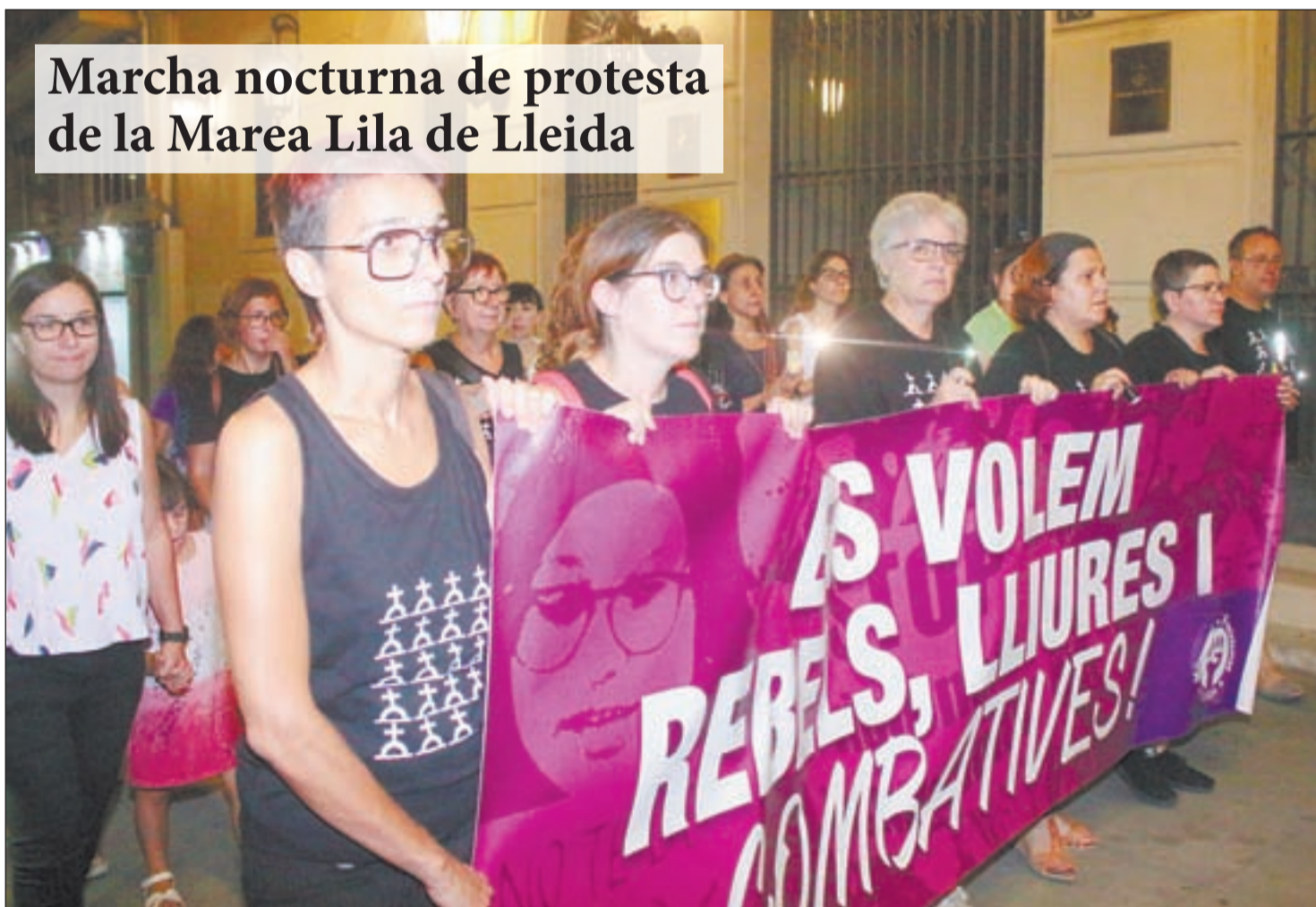
El Eix Comercial de Lleida acogió la marcha reivindicativa que el colectivo lleva a cabo cada primer lunes de mes

► Arrestado por atacar a una pareja y efectuar tocamientos a la mujer en Lleida