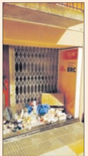
Basura en la sede de Esquerra de Tàrrrega

Los CDR echan basura en sedes de Lleida de ERC y PDeCAT