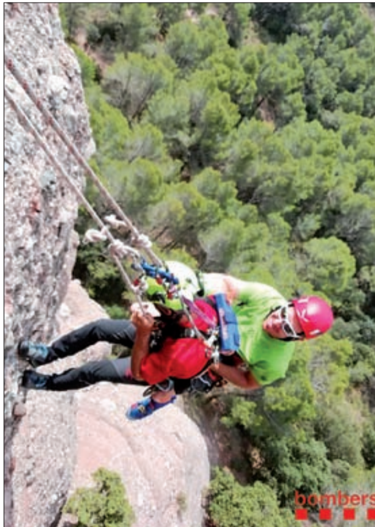
Imatge del simulacre de rescat que es va realitzar ahir