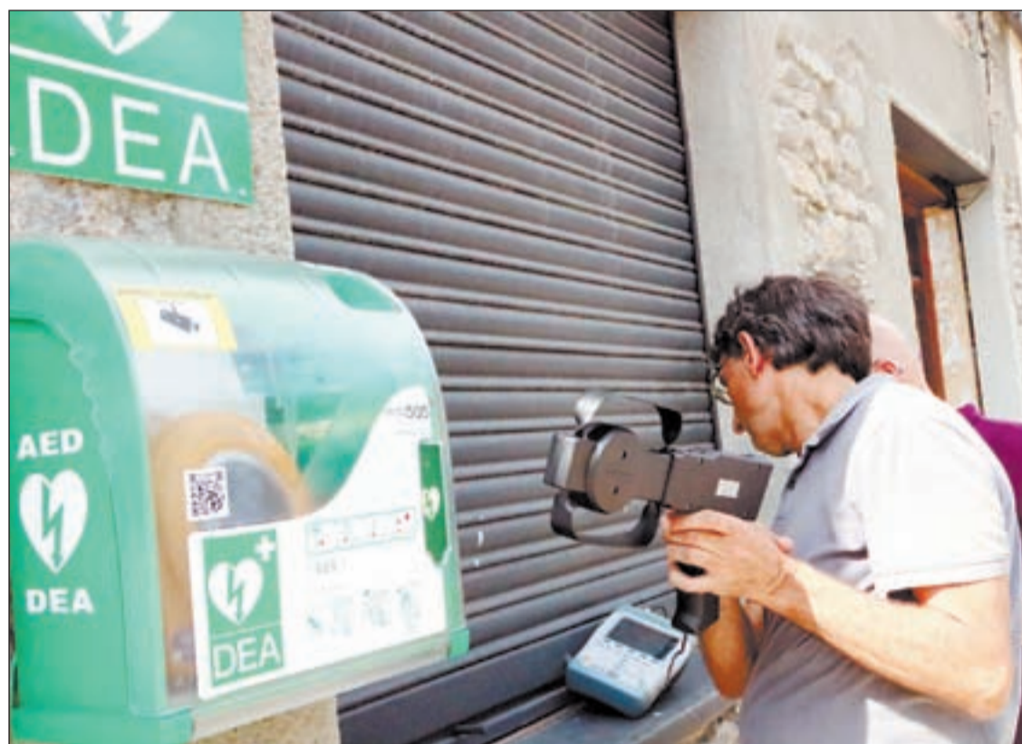
Un tècnic del Centre de Telecomunicacions i Tecnologies de la Informació, amb el DEA

La majoria de conductors es trobaven que no podien tancar ni obrir el vehicle amb els comandaments, però a més alguns