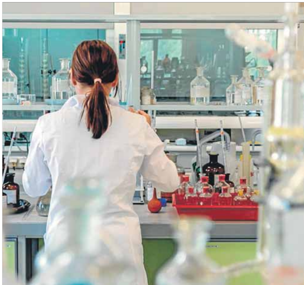
La recerca a les universitats o en programes com Icrea és un gran actiu, però és fràgil

Per relativitzar el cost d'aquest segon programa, considereu Icrea. Aquest programa de la Generalitat ha contractat uns