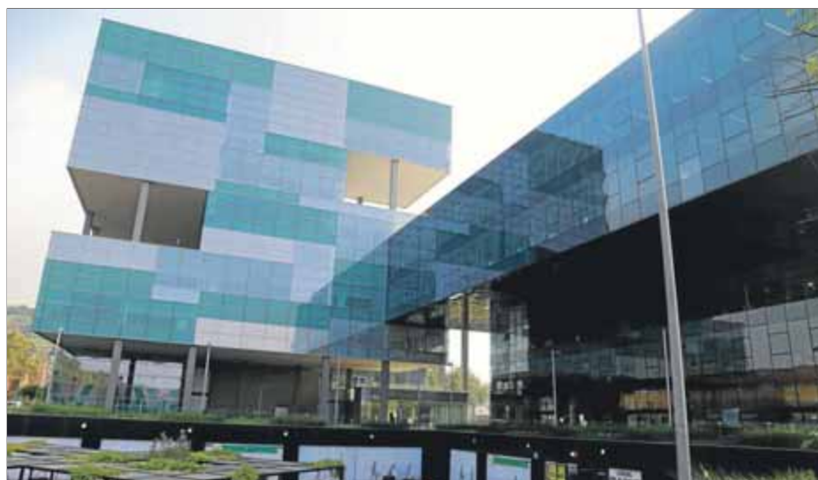
L'Agència Tributària de Catalunya centralitzarà el pagament de tributs estatals

Pompeu Fabra al Pont de Vilomara; el Bruel-Empuriabrava a Castelló d'Empúries; Magraners de Lleida; Pla de l'Avellà a Cabrera de Mar; Montagut a Santa Susanna; Pallerola a Sant Celoni; Teresa Martorell al Vendrell; Montsant a Cornudella de Montsant; Agustí Barberà a Amposta; Can Llobet a Barberà del Vallès; Sant Esteve a Castellar del Vallès; El Viver a Montcada; El Martinet i Els Pinetons a Ripollet; Teresa Altet a Rubí, i Pere Viver a Terrassa. Pel que fa al pla de xoc per l'incendi de la Ribera, el Segrià i les Garrigues, l'Institut Català de Finances establirà línies de crèdit per valor de cinc milions per a inversions en les explotacions agrícoles i ramaderes afectades. El govern restaurarà la coberta vegetal cremada.