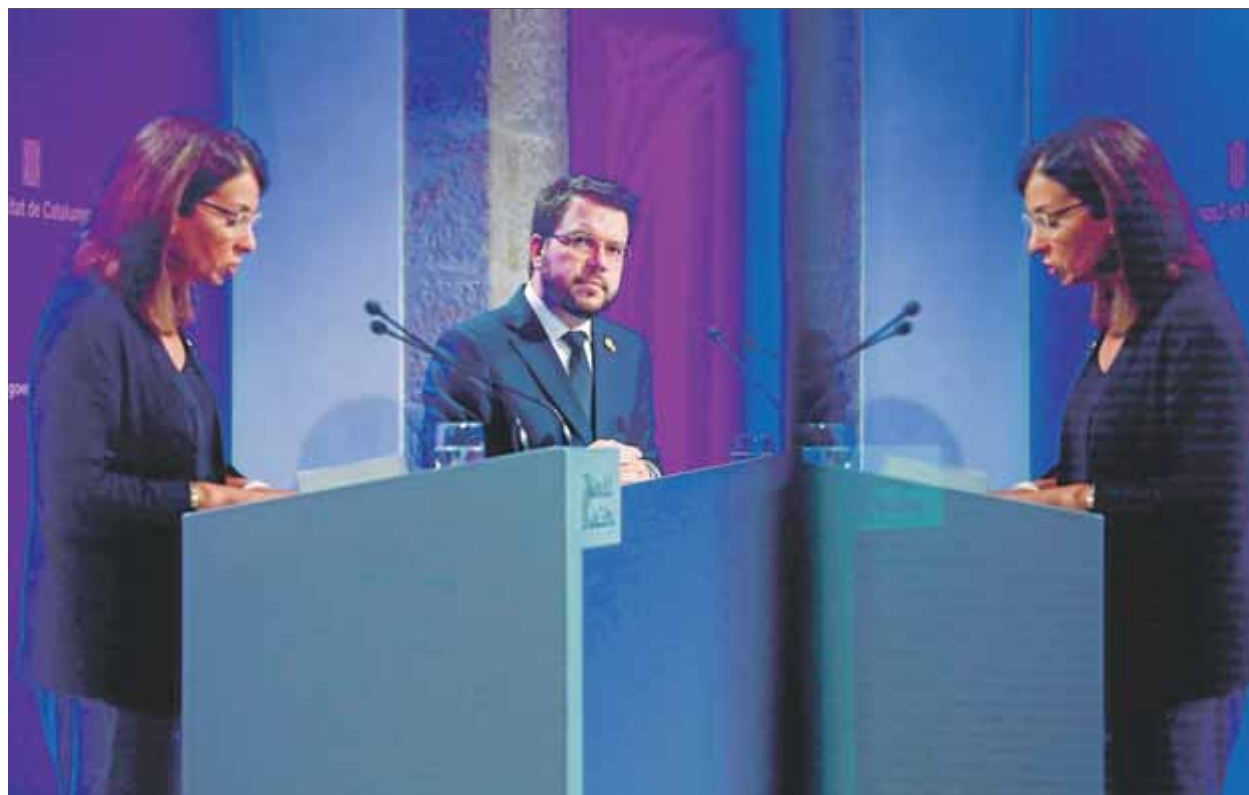
Meritxell Budó i Pere Aragonès, i un reflex de la primera, en la roda de premsa d'ahir després del Consell Executiu

NOU • El pla inclou una política integral, que englobarà tots els estadis del cicle fiscal