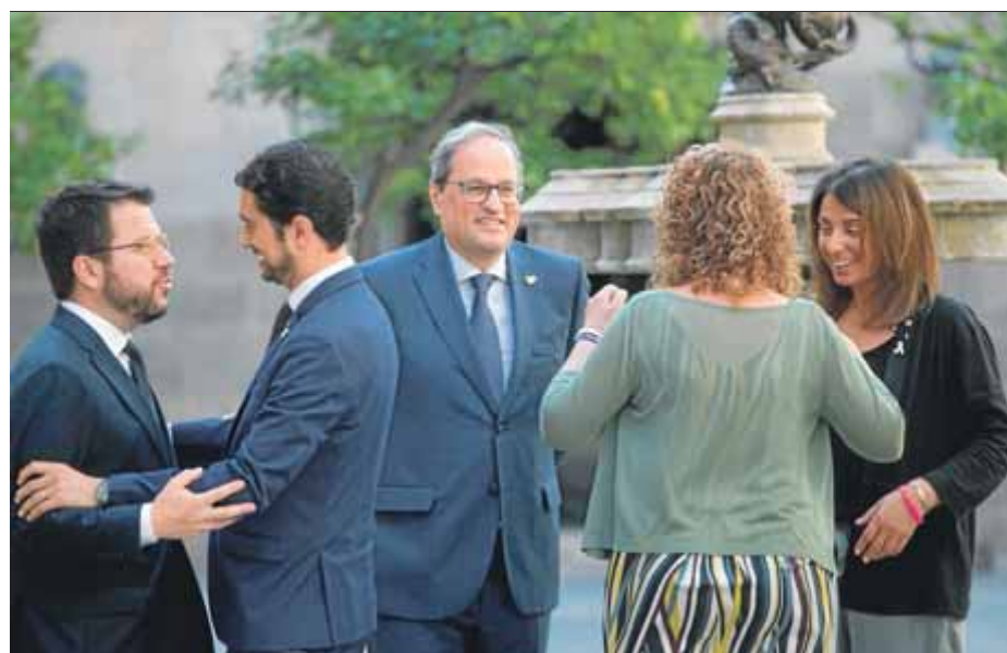
Els membres del govern van exhibir ahir bona sintonia abans de marxar de vacances

voler exhibir bones relacions entrant barrejades a l'últim Consell Executiu abans de vacances, després que transcendís a més que aquesta setmana les sis conselleres van sopar plegades a Barcelona– van fer pinya, ja que el vicepresident, Pere Aragonès, també va assegurar taxativament, al costat de Budó, que ell participarà en els actes de la Diada, “també en el de la tarda”, per reclamar la independència, tal com ha fet els últims 20 anys. “No ens sentim exclusos, ens sentim cridats i hi serem”, va resumir la