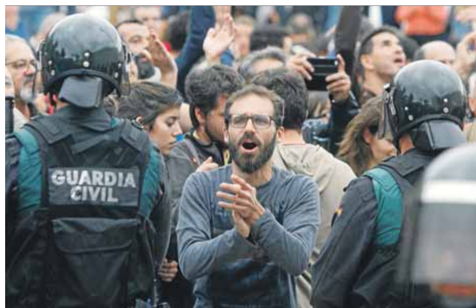
Desobediència massiva i resistència pacífica, dues claus de l'1-O a Catalunya ■ L. SERRAT

No tractem amb un sistema democràtic consolidat, avesat a la negociació i al diàleg, tractem amb un sistema intransigent acostumat a fer la seva per decret, i això no és democràcia. Contra aquesta feblesa democràtica només ens resta fer-la visible resistint, perquè re-