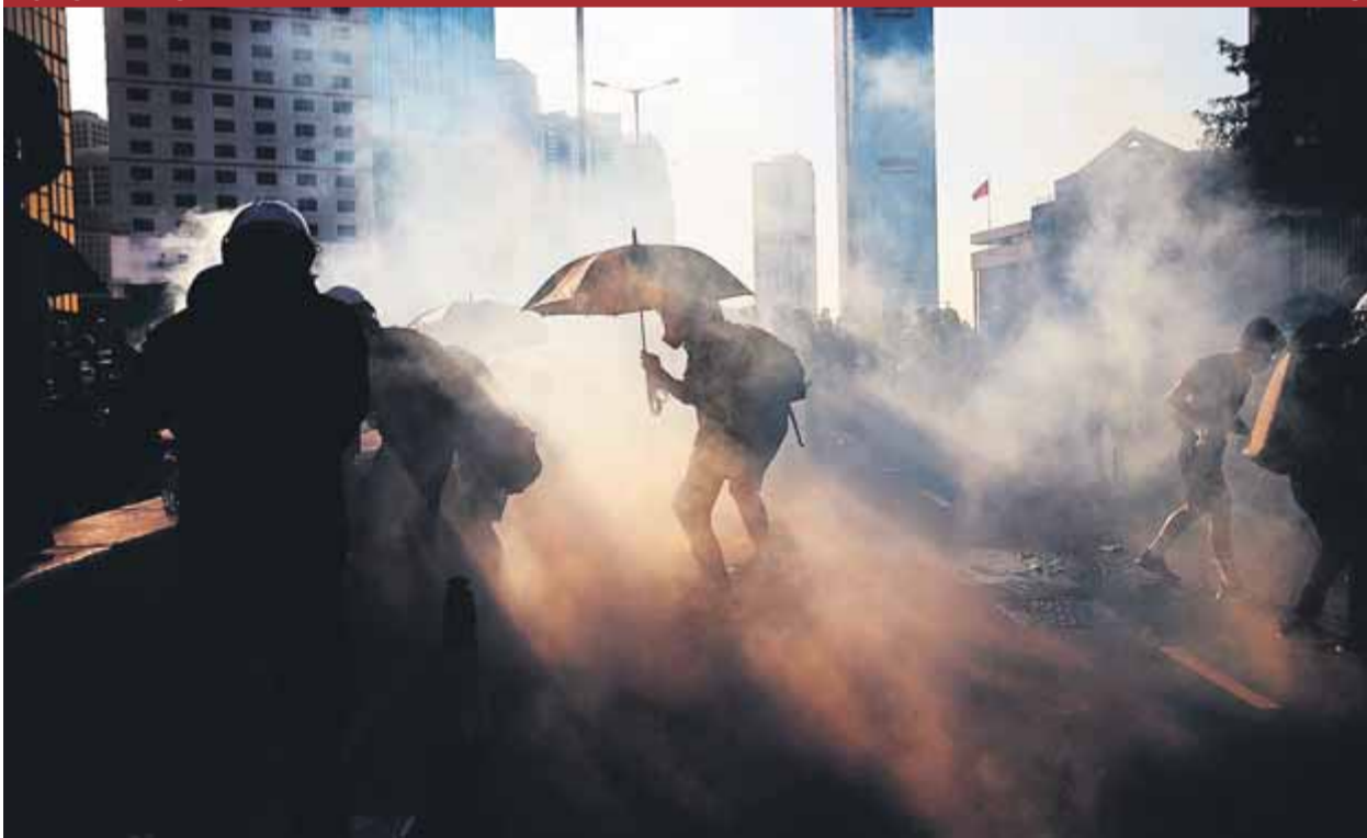
Manifestants contra la llei d'extradició fugen del gas que els llança la policia a Hong Kong