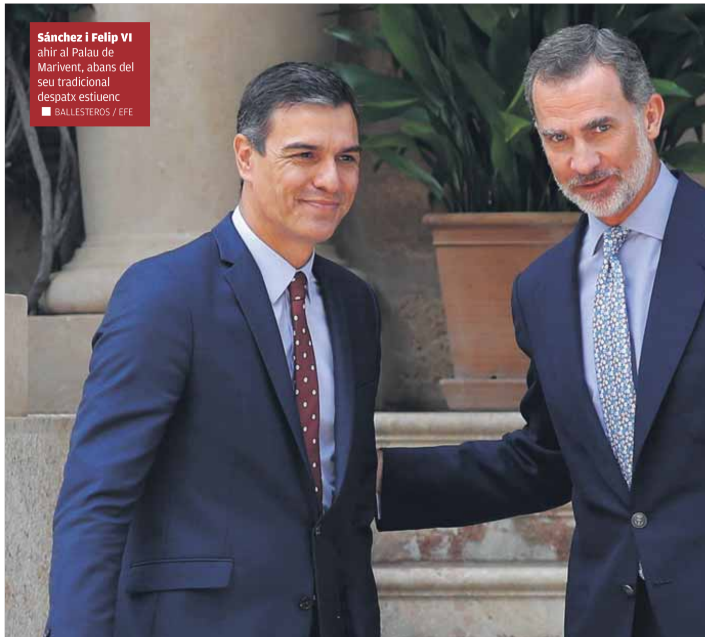
Sánchez i Felip VI ahir al Palau de Marivent, abans del seu tradicional despatx estiuenc

A l'hora d'explicar el vet a Rufián i Borràs en una agenda en la qual dilluns tenia cabuda Baldoví i que el 19 d'agost el portarà a visitar Bilbao per reunir-se amb el president del PNB, Andoni Ortuzar, Sánchez ho va fer amb una traducció particular del que ell creu que li van dir les urnes. “El 28 d'abril ens van demanar un govern progressista que no depengui de forces independentistes. Com a portaveu parlamentària, Adriana Lastra ha fet una tasca d'interlocució amb ERC i JxCat, però jo amb qui parlaré i em centraré, lògicament, és amb Unides Podem, el PP i Ciutadans perquè són les tres forces que de debò tenen la clau per desbloquejar la situació. Amb qui jo he de parlar és amb Iglesias, amb Pablo Casado, i espero que en aquesta ocasió Albert Rivera es digni a parlar amb mi”, va justificar el president en funcions. I això que ERC té 14