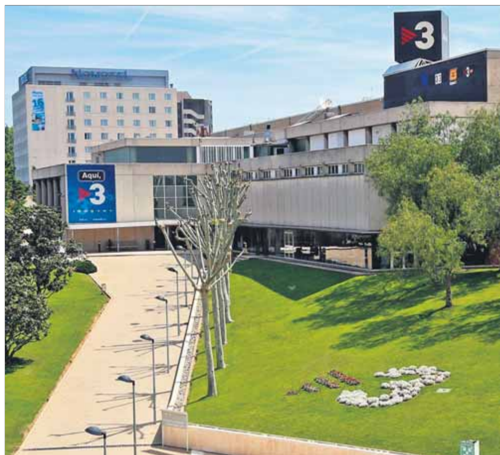
Les instal·lacions de TV3 a Sant Joan Despí ■

Des d'aquesta nova premissa, el govern podrà afrontar amb més força alguns dels problemes que el temps ha anat gangrenant. És del tot obvi, per exemple i entre aquests problemes, que els mitjans de comunicació públics de la Generalitat necessiten adequar-se amb solvència als profunds canvis que el sector ha experimentat, no ja amb la tercera, sinó amb la quarta revolució industrial. Televisió de Catalunya i Catalunya Ràdio no són, com proclamen alguns ca-