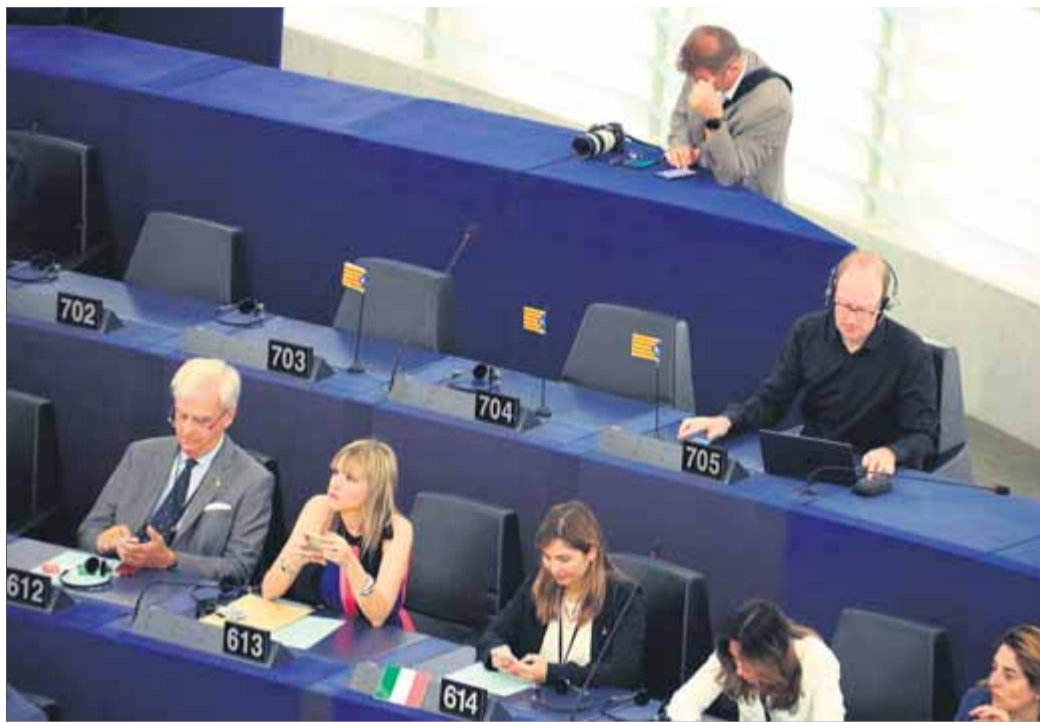
El Tribunal de Luxemburg haurà de decidir aviat sobre els tres escons buits de l'europarlament