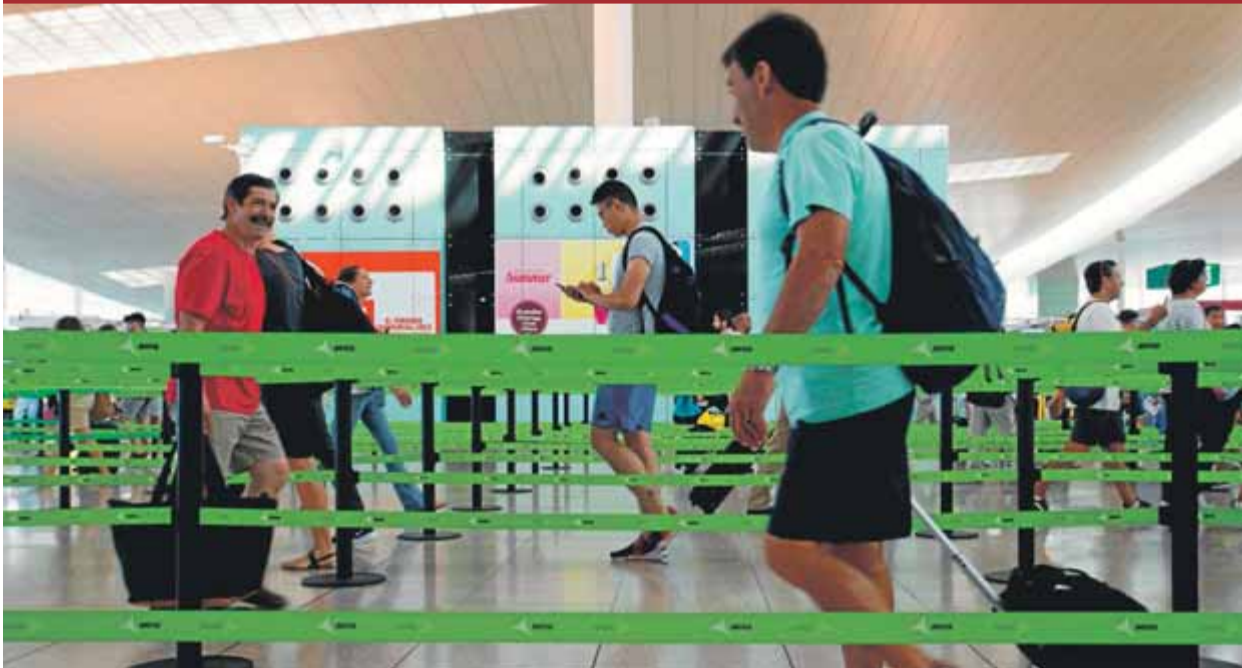
Passatgers transitant amb tota normalitat a través de les cintes, en la tercera jornada de vaga a l'aeroport

PENJADA • La norma catalana està encallada des del 2015 i es reprendrà a la tardor, quan s'hagin renovat l'FMC i l'ACM AMENAÇA • La lesiva normativa estatal és al jutjat i el PSOE no l'ha derogada