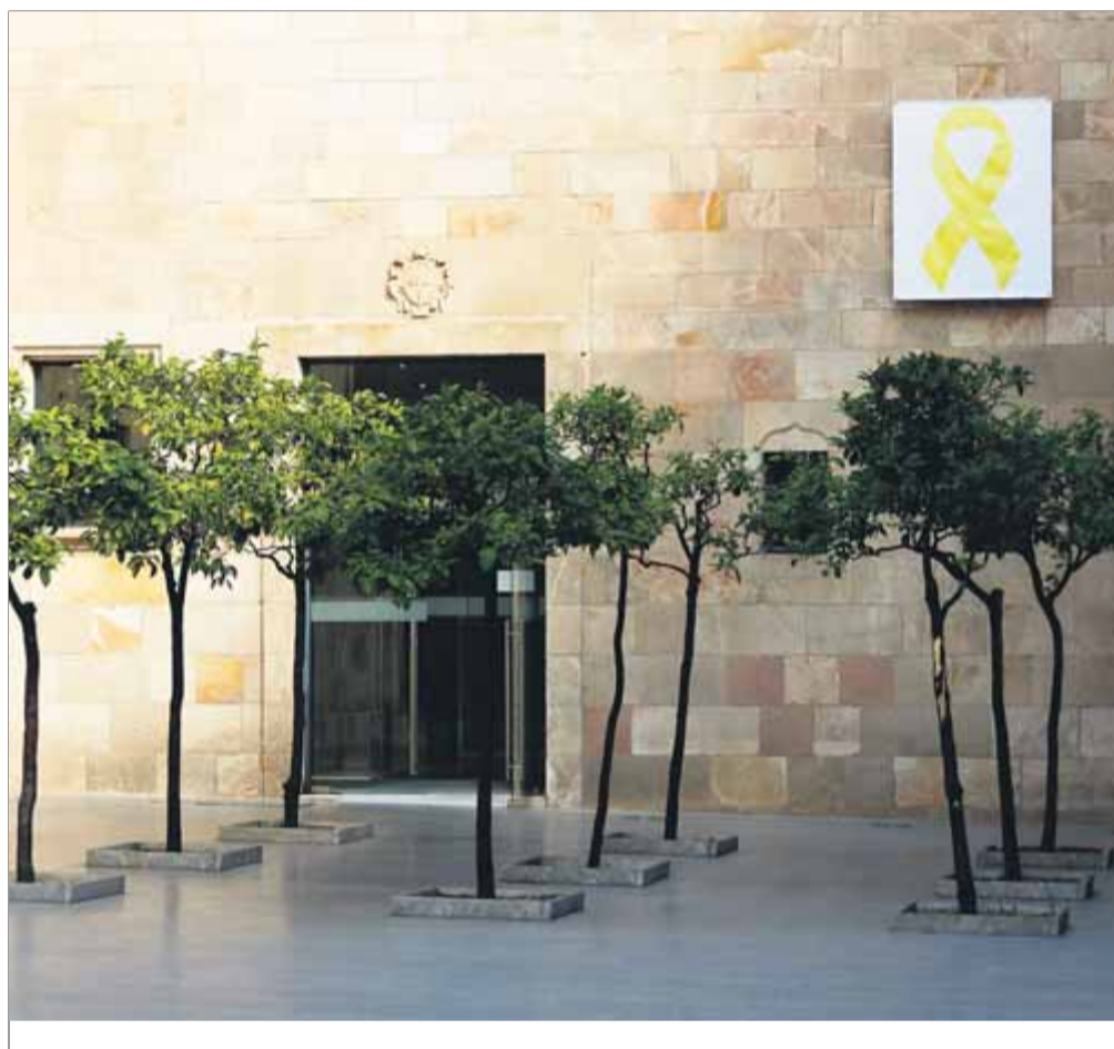
El Pati dels Tarongers (Palau de la Generalitat) presidit per un llaç groc