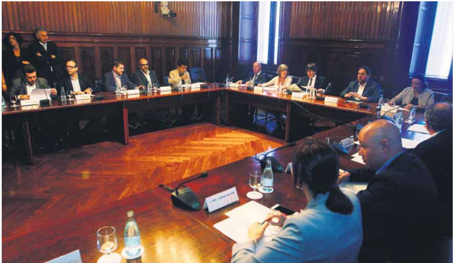
Reunió del juliol del 2016 del consell institucional del procés de debats dels governs locals al Parlament per tractar les lleis territorials i de finançament