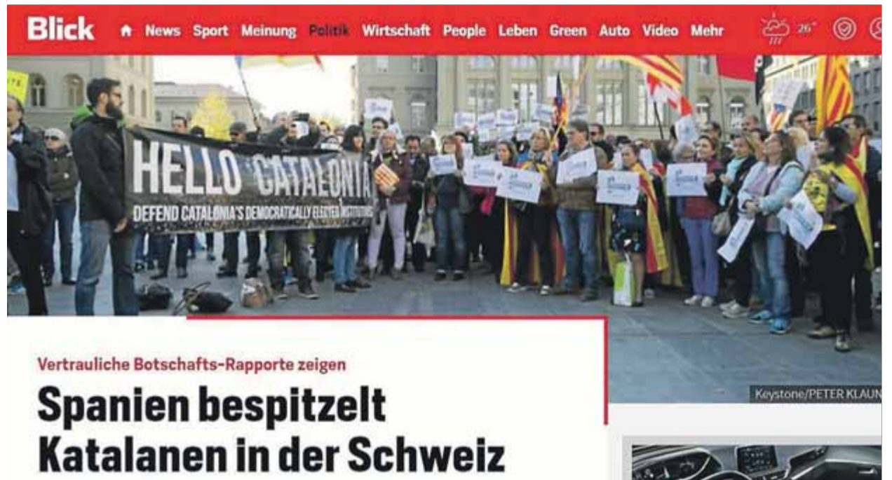
Captura de pantalla del diari 'Blick', amb el titular sobre la informació de l'espionatge