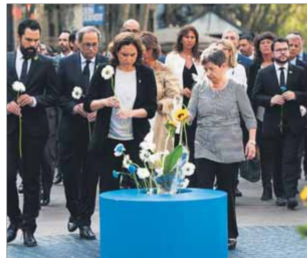
Colau, Torra, Torrent i Cunillera, encapçalant l'any passat l'homenatge a les víctimes a la Rambla

Aquest acte, l'organitza l'Ajuntament amb la Unitat d'Atenció i Valoració d'Afectats pel Terrorisme, i no té res a veure amb el que l'Associació Catalana de Victimes d'Organitzacions Terroristes (Acvot) ha convocat per al mateix dissabte a les 11.30 h a Canaletes amb el suport del PP i Ciutadans. ■