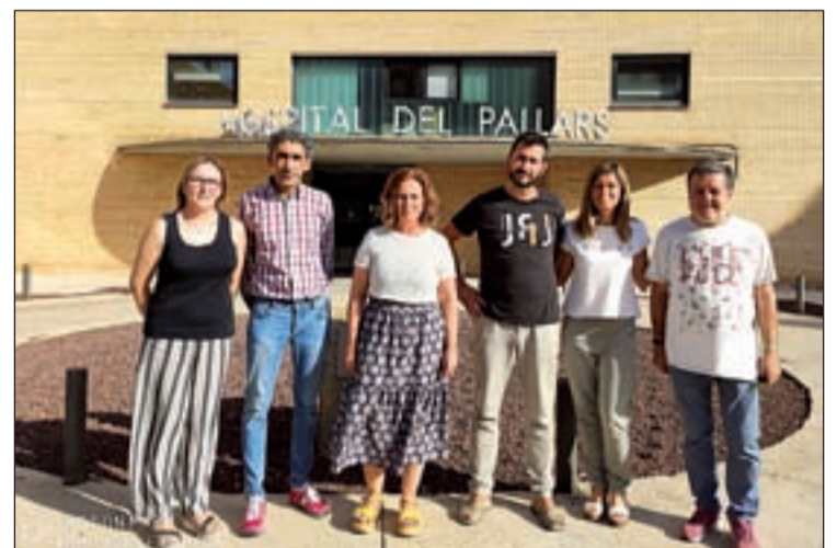
Representants de Compromís per Tremp davant l'Hospital

Al març d'enguany Compromís per Tremp (CxT) va impulsar un acord a l'Ajuntament de Tremp per instar la Generalitat a aplicar mesures que milloressin la capacitat de contractació dels hospitals públics de les zones de muntanya, preveient, per exemple, el pagament de complements de ruralitat als professionals sanitaris. "A data d'avui, no s'ha aplicat cap mesura i la situació continua deteriorant-se. L'Hospital del Pallars a Tremp, per exemple, compta amb 13 especialitats mèdiques, i actualment li falta manca el 40% dels especialistes", denunciava ahir Compromís en un comunicat.