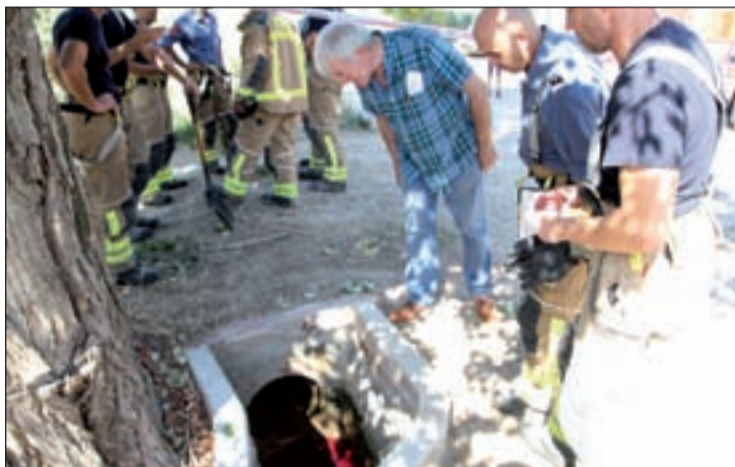
Moment en el que s'anализava una de les zones afectades

La fuga de gasoil va obligar a Protecció Civil a activar en fase d'alerta el pla especial d'emergències per accidents en el transport de mercaderies perilloses per carretera i ferrocarril a Catalu-