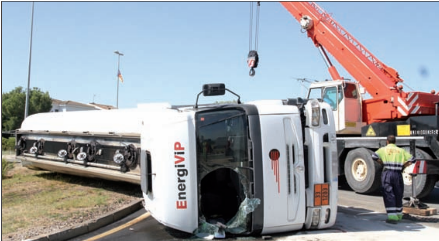
El camió va bolcar al quilòmetre 14,5 de l'N-230, en fer una rotonda, i el camioner va resultar ferit de caràcter menys greu