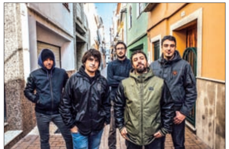
Zoo finaliza la gira en Barcelona el 1 de noviembre

El pabellón polideportivo de Artesa de Segre acogerá la noche de este viernes, a partir de la 1.00, el concierto del grupo valenciano Zoo, en el que será el último concierto en tierras leridanas de la gira en que la banda está celebrando su quinto aniversario y que le ha llevado al mítico festival Fuji Rock en Japón.