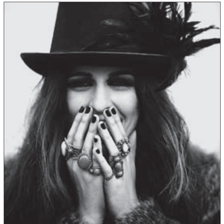
Marisa ha contado con colaboraciones de lujo

En este Consciente , además, Marisa ha compuesto la música de dos canciones, mientras que el resto son versiones de algunos de sus referentes, como Chavela Vargas, Violeta Parra, Dulce Pontes, Mercedes Sosa o Víctor Manuel, con quien participó en su gira de 50 años y de quién se deshace en elogios. "Es una persona clave para mí, me invitó a cantar