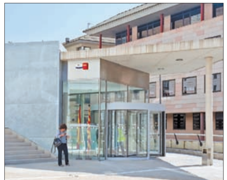
Va succeir a la Seu i les parts van arribar a un pacte

Els fets van passar el 26 d'agost de 2016, quan els Mossos d'Esquadra van inspeccionar el 'frankfurt'. En l'interior del local, la policia catalana va intervenir cocaïna, telèfons, 675 euros fraccionats, dos ganivets amb restes de la citada droga i una bascula de precisió. Davant de tot això, els agents van detenir l'home que va ser jutjat