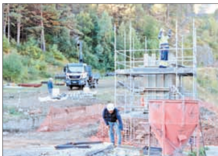
Imatge de les obres que s'estan realitzant

sec. El COU és un centre obert al públic en general que acull visites escolars a tots els nivells educatius, pràctiques d'estudiants universitaris i visites del públic familiar. El COU es troba en l'àrea d'influència del servei de transport de la Línia Lleida-La Pobla de Segur (estació d'Àger), i FGC compta amb una oficina de gestió a Balaguer, propera a la ubicació del COU, que pot permetre gestionar el centre esmentat de forma eficient i eficaç.