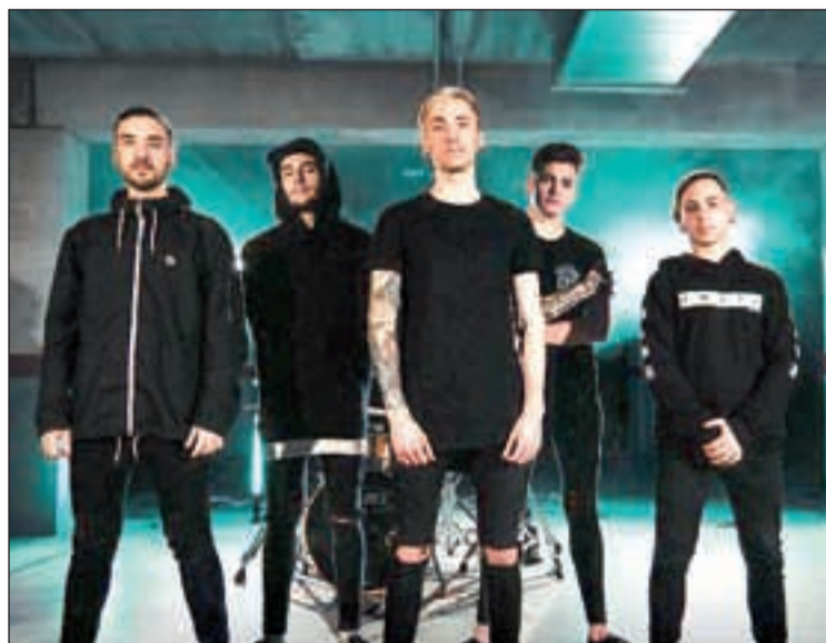
Close To The Sky es una joven y ambiciosa banda

La propuesta de este quinteto se balancea entre el metalcore progresivo y el Djent creando una sonoridad caracterizada por un eclecticismo potente y enérgico.