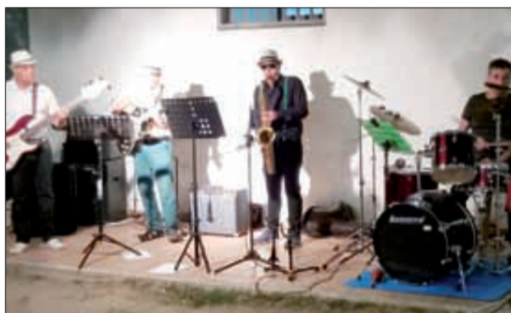
El cuarteto ofrece hoy dos bolos en la plaza del Dipòsit

La Mostra de Cervesa Artesana, que se desarrolla hoy en la plaza del Dipòsit, contará con dos pases concertísticos -13.30 y 18.30 horas- a cargo de Blanquers Jazz Quartet, una formación de jazz, swing y bossa nova en cuyas filas militan dos ex Topiloco Aviador.