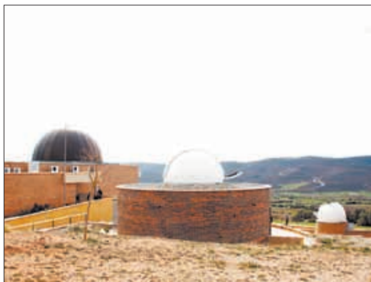
Imatge d'arxiu del COU d'Àger, a la comarca de la Noguera

Segons Plensa, "esperem i confiem que el Consell Comarcal continui portant la gestió del COU" i indicà que des de la Generalitat se'ls ha comunicat que "es signarà un conveni exactament