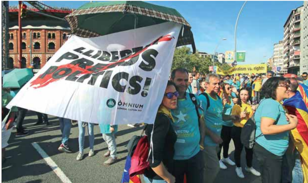
Una pancarta en la manifestació d'ahir a Barcelona en favor de la llibertat dels presos polítics

Tant a Lledoners, on hi ha empresonats els Jordis, Oriol Junqueras, Joaquim Forn, Josep Rull, Jordi Turull i Raül Romeva, com a les presons de dones on hi ha tancades Dolors Bassa i Carme Forcadell, la rutina va ser la d'un dia festiu, però amb menys activitat pel fet de ser entre setmana. En jornades com la d'ahir, els presos no poden rebre visites, a diferència dels festius del cap de setmana. Ahir tampoc es feien actes religiosos ni lúdics a les presons com ara les