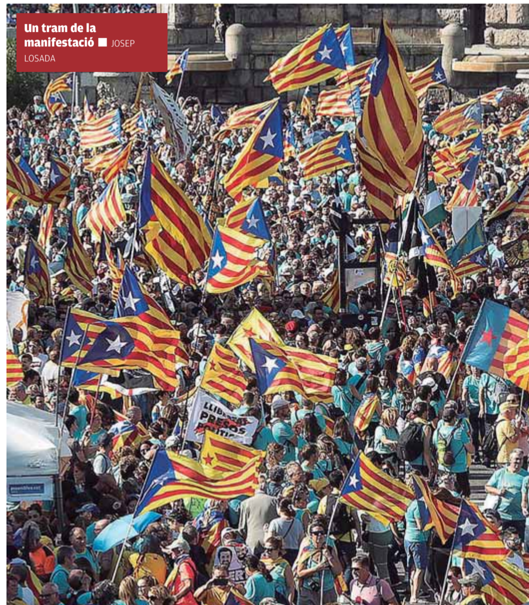
Un tram de la manifestació

El govern va encetar, a les nou d'un matí plujós a Barcelona, les ofrenes al monument de Casanova, que també van fer tot seguit les comitatives del Parlament, l'Ajuntament i la Diputació de Barcelona. La tradicional ofrena floral també la van fer al llarg del matí la gran majoria de partits excepte Ciutadans i el PP, que fa anys que no hi participen amb l'objectiu de reforçar el seu discurs segons el qual la Diada només és la festa dels independentistes. El president del Parlament, Roger Torrent, va posar l'èmfasi en el nou cicle que, segons ell, s'obrirà amb la sentència del Suprem i que obligarà a una resposta que aglutini una gran majoria de la societat catalana que està en contra de la repressió i comparteix els valors republicans, una crida a la unitat del sobiranisme que també comparteix Catalunya en Comú si la prioritat és oposar-se a