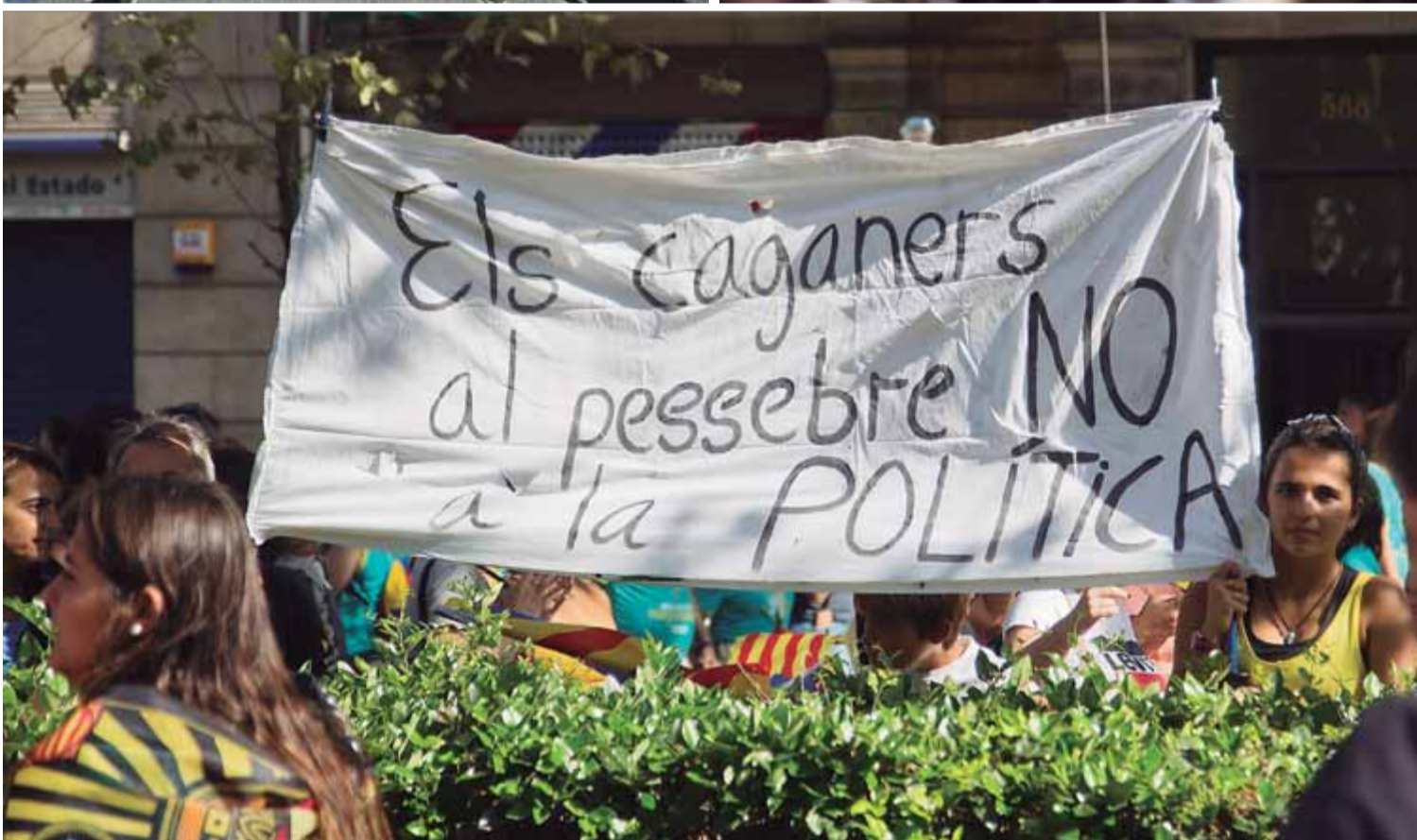
Pancartes que reclamaven unitat i tota mena de manifestacions de cultura popular com castellers van omplir els trams de la manifestació ■ Q.P.

dentistes catalanes s'esforcen a escarnir-les comparant-les amb les accions coreografiades de règims totalitaris com el de Corea del Nord, la realitat és ben diferent. Per la Gran Via es podia veure gent que pujava cap a la plaça Espanya, rovell de l'ou de la manifestació; grups que s'allunyaven d'Espanya i moviment cap a totes bandes, però sense empentes. Els somriures van continuar sent marca de la mobilització indepen-