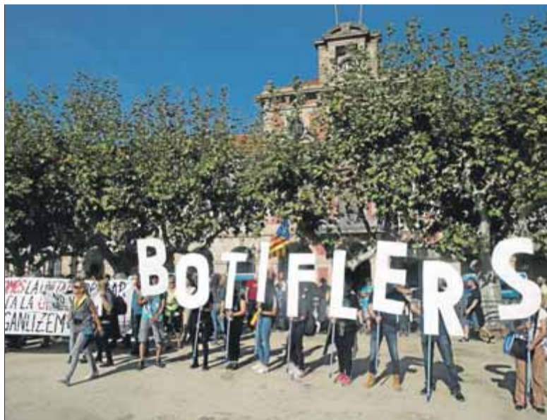
Protesta davant del Parlament a primera hora de la tarda i, al costat, el llançament de tanques ja al vespre

El primer acte de protesta, però, ja es va produir a la una del migdia, tot i que aquesta vegada els concentrats no van poder accedir a l'entorn de l'edifici institucional. El Parlament havia quedat tancat i barrat a primera