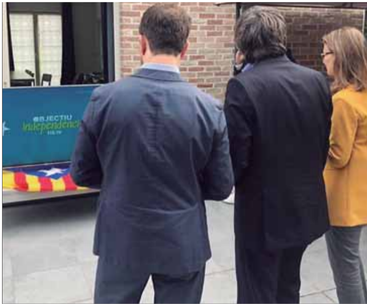
A l'esquerra, Comín, Puigdemont i Serret segueixen la manifestació a Waterloo i, a la dreta, la foto penjada per Rovira a Instagram

A la tarda, i després que el dia també s'hagués llevat fred i plovisquejant a Waterloo, el sol va sortir i es va poder seguir la retransmissió de TV3 des de la terrassa posterior de la Casa de la República. Amb el president Carles Puigdemont, hi havia el mateix Comín i l'exconsellera Meritxell Serret, a més de catalans pertanyents a col·lectius residents a Bèlgica, a qui el Consell per la República va convidar per seguir la tradició iniciada l'any pas-