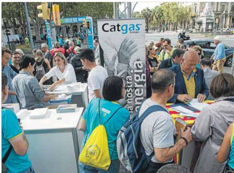
Molta gent demana informació a les empreses de subministrament catalanes

Un altre dels cavalls pels quals aposta l'ANC són les cambres de comerç ("Què suposa tenir unes cambres de comerç que ara treballin per la independència? Que implicava que treballassin per l'autonomisme com fins fa