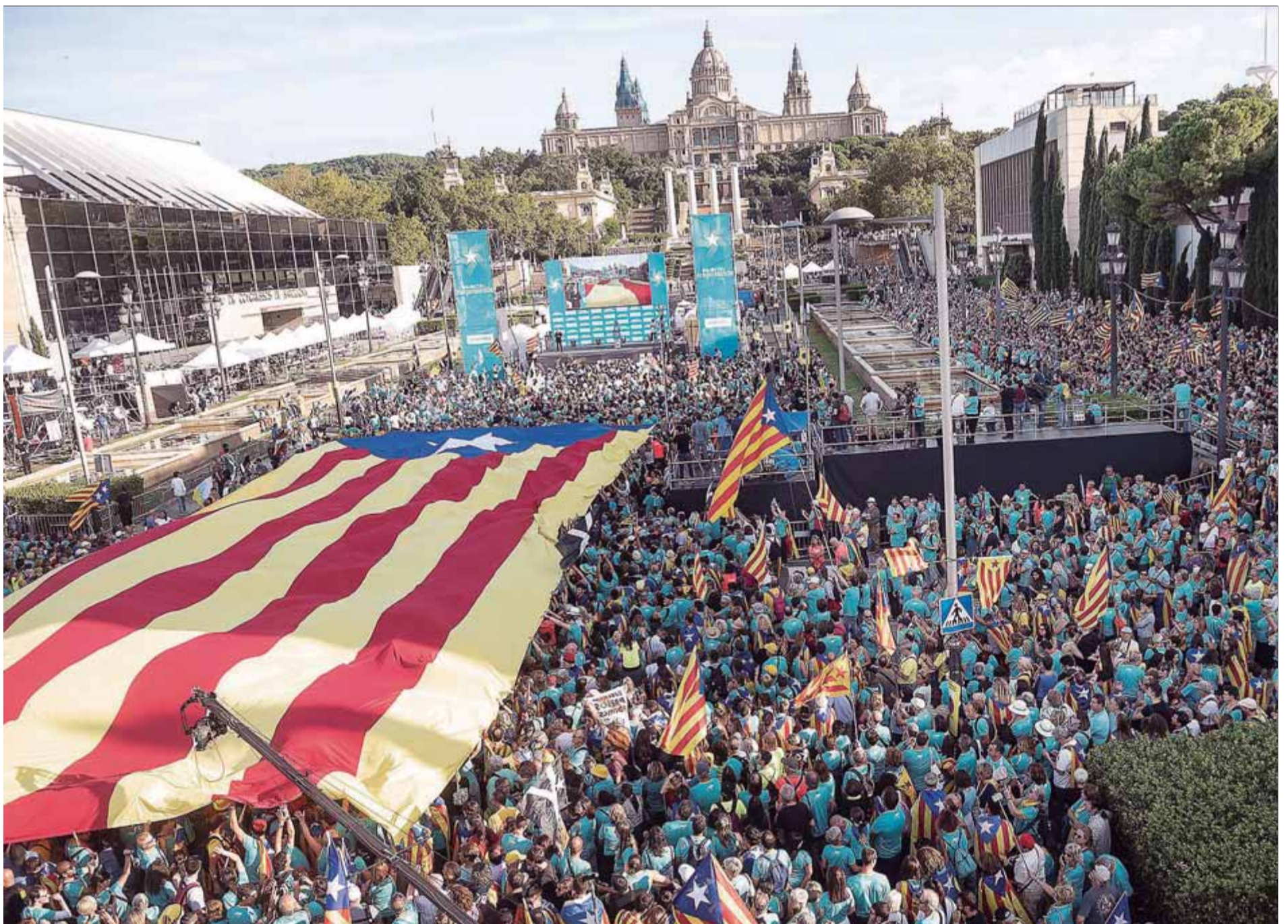
L'avinguda Maria Cristina, durant l'acte final de la gran manifestació d'ahir a la tarda

RESPOSTA • Torra i Aragonès defensen que els partits i el govern també tenen com a objectiu la independència