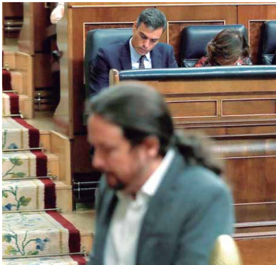
Sánchez i Iglesias van escenificar la ruptura que aviva la repetició electoral