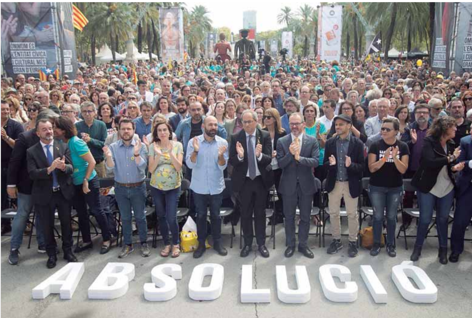
L'acte d'Òmnium per l'absolució dels presos va reunir el govern, els partits, amb els Comuns inclosos, els sindicats i les entitats sobiranistes