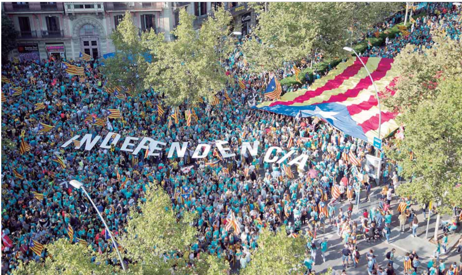
La marea de samarretes de color turquesa va anar omplint la Gran Via de Barcelona fins a la plaça d'Espanya de manera gradual des de les tres de la tarda ■ QUIM PUIG