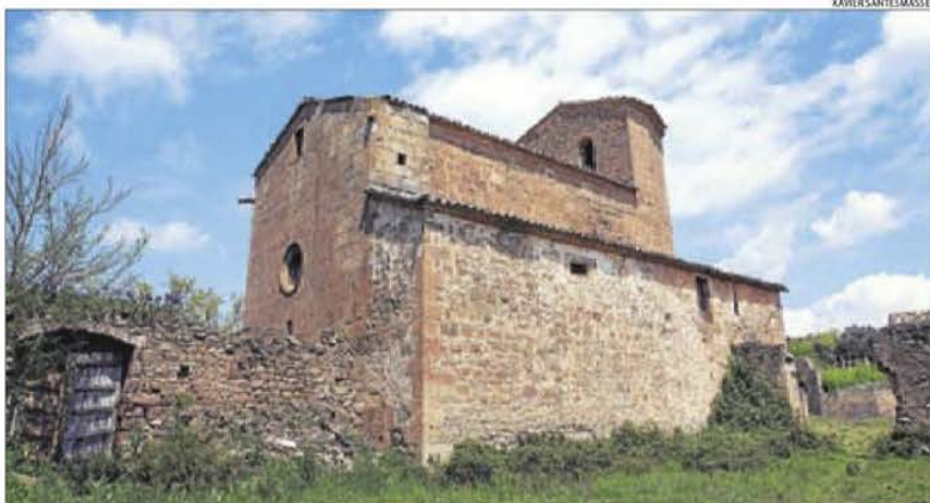
Església gòtica del segle XVI de Sant Martí de Llanera, al municipi de Torà, a la Segarra.