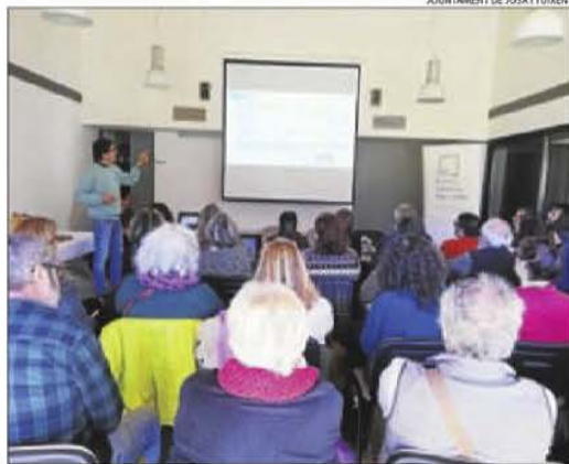
Imatge de la jornada que es va celebrar ahir a Josa i Tuixent.

En aquest sentit, la comarca més perjudicada va ser el Jussà, que el 2018 tenia 189 habitants menys que el 2017. No obstant, les Garrigues, al pla, lidera la pèrdua de població a Lleida amb 204 veïns menys. A Catalunya, només el Montsià (408 menys), Baix Ebre (312) i la Ribera d'Ebre (239) superen aquest descens. Aquesta comarca és també la més envellida, amb un de cada quatre ciutadans amb 65 anys o més, de la