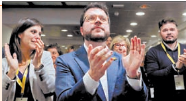
El Consell Nacional del partido avaló ayer la decisión

Los republicanos asumen el "riesgo" pero dicen ratificar su apuesta por el diálogo.