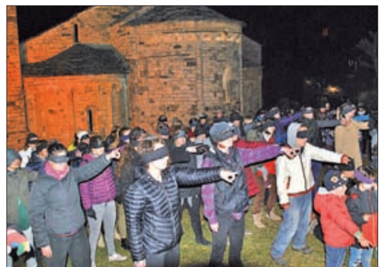
Les dones de la Ribagorça van fer la performance

L'entorn de l'església de Sant Clement de Taüll va acollir ahir a les 19.00 hores la versió ribagorçana de la popular performance Wl Violador ets tu , fenomen viral a nivell mundial que s'ha dut a terme en molts punts i ciutats del planeta mitjançant la concentració de dones cantant i ballant contra el masclisme i la violència sexual.