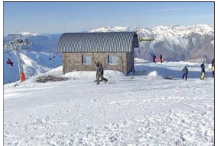
El telecadira de Puig Falcó és el més alt de Catalunya

D'altra banda, durant el passat cap de setmana, l'estació de Boí Taüll a la Vall de Boí, va celebrar el Dorado Freeride, adreçat a nens