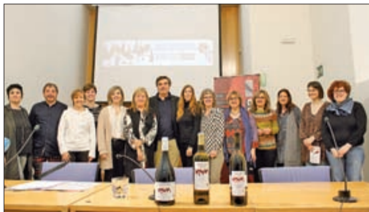
Autoritats i representants de les biblioteques

En aquesta iniciativa, que té el principal objectiu de fomentar la lectura a partir de la seva relació amb la cultura vinícola, participen 68 biblioteques públiques de Catalunya -9 d'elles de la demarcació lleidatana, les mateixes que l'any passat- i onze denominacions d'origen que desenvoluparan les seves activitats durant un