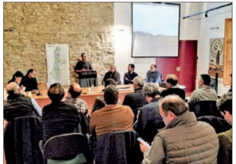
Àger va acollir una reunió per impulsar el projecte

L'Alta Ribagorça participa en el projecte de recuperació del camí tradicional de la Cabanera que uneix l'Alt Pirineu i Lleida des de Taüll fins a Linyola. La iniciativa posa en valor la cultura tradicional transhumant i potenciar els recursos naturals del territori, la biodiversitat i el paisatge i l'oferta turística i rural per lluitar contra el despoblament rural.