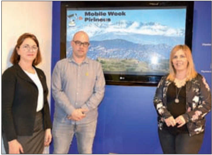
El certamen va inaugurar-se ahir a Tremp