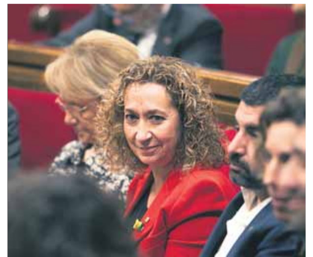
La consellera de Justícia, Ester Capella, al Parlament, en una imatge d'arxiu

que l'aplicació d'aquest article depèn de les juntes de tractament de les presons, en cap cas del govern, i ha de ser avalada posteriorment per un jutge. Segons Capella, “òbviament és previsible” que la resta de presos polítics del govern anterior puguin acollir-s'hi. Ja estan fent els tràmits pertinents. “És una manera de complir la sentència”, va remarcar. “Si fóssim una república, no estarien en la presó i no tindriem exiliats”, va observar Capella, que va insistir en la necessitat d'una amnistia. ■