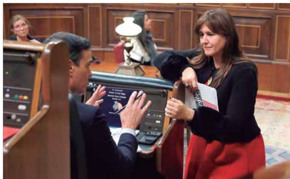
Borràs conversant amb Sánchez al seu escó en el ple del Congrés

Borràs denuncia que el cas de la ILC no existiria si