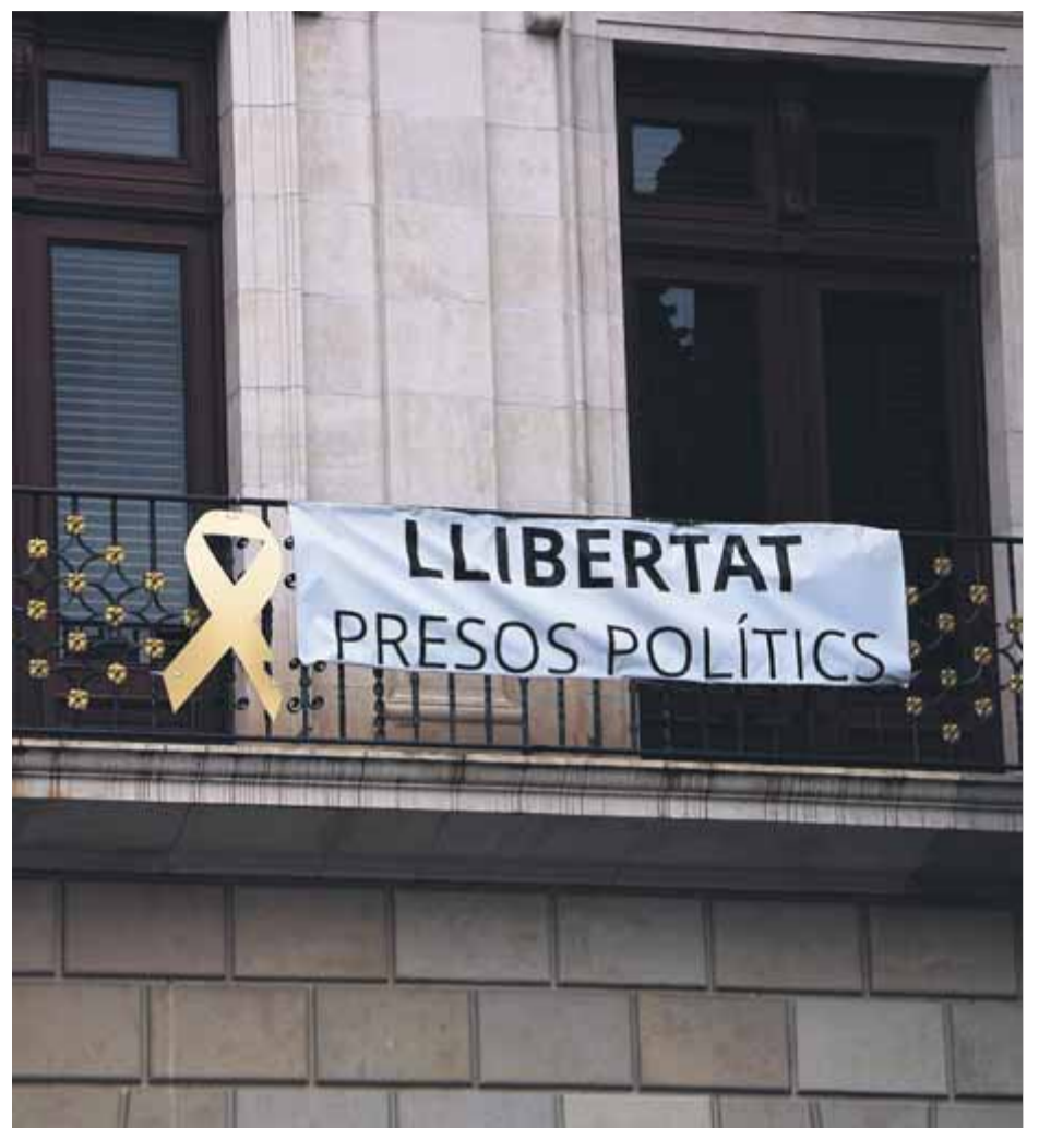
La pancarta arrencada en un acte vandàlic a la façana de l'ajuntament de Reus

Per aquesta oficina que depèn del Departament de la Vicepresidència aquests episodis són conseqüència de “l'augment de la tensió política” que ha viscut Catalunya els darrers anys pel conflicte polític i, encara que es tracta d'episodis de violència relativament lleus, l'oficina els qualifica en el seu informe anual del 2019 com a “igualment preocupants”. Per exemple, ha pogut registrar 212 atacs a seues de partits polítics tot i que suposa que n'hi ha hagut més. ■