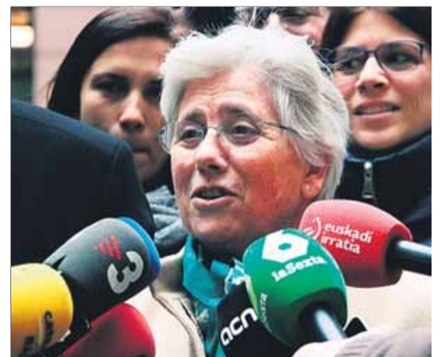
Clara Ponsatí, a l'exterior del Parlament Europeu a Estrasburg, el 10 de febrer del 2020

presentada, s'adjunta la sentència del judici de l'1-O, com també la interlocutòria de processament de Ponsatí i les ordres de detenció contra seu. Ponsatí s'enfronta a una euroordre per l'1-O a Escòcia, on resideix, perquè el TS considera que després del Brexit allà no té immunitat com a eurodiputada. ■