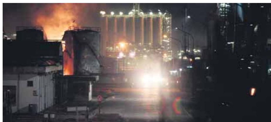
Explosió a la fàbrica de l'empresa Indústries Químiques de l'òxid d'Etilè (Iqoxe)

■ Els grups aproven per unanimitat la creació d'una comissió d'estudi per aclarir l'explosió a la Canonja