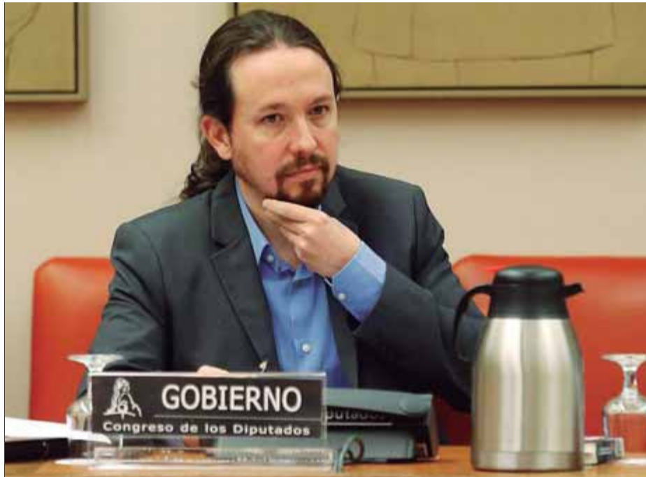
El vicepresident, Pablo Iglesias, intervenint ahir en la comissió del Congrés

La queixa de JxCat en aquesta inauguració de la legislatura és que el PSOE juga a marginar els fidels a