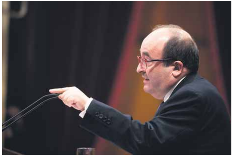
Miquel Iceta intervenint en el ple del Parlament el 4 de gener passat

El socialista va reiterar que no considera que siguin presos polítics, i va afegir que no els ha anat a