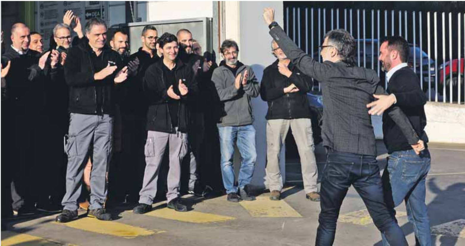
El president d'Òmnium Cultural, Jordi Cuixart, rebut ahir pels treballadors de la seva empresa a Sentmenat

■ Càlida acollida al president d'Òmnium Cultural a la seva empresa, a Sentmenat ■ El dirigent independentista és el primer pres polític que fa ús de l'article 100.2 del reglament penitenciari