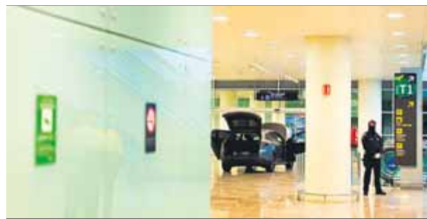
El cotxe dins del vestíbul de la terminal de l'aeroport

Un dels capítols del full de ruta que ha suscitat més debat, en forma d'esmenes, és l'apartat relatiu al lligam que ha de tenir l'ANC amb els partits independentistes. El plantejament de base que fa el text és que la via unilateral és l'únic mecanisme viable per assolir la independència. I, sobre això, hi ha força consens intern. La cosa, però, comença a grinyolar quan el document parla de donar suport electoral només a les formacions que apostin per aquesta fórmula i, a més, s'assenyala que "es denunciarà públicament" les que hagin defensat la unilateralitat però, a la pràctica, la incompleixin. Algunes agrupacions no comparteixen aquesta tesi, que interpreten com una "amença", i per això hi han fet esmenes. ■