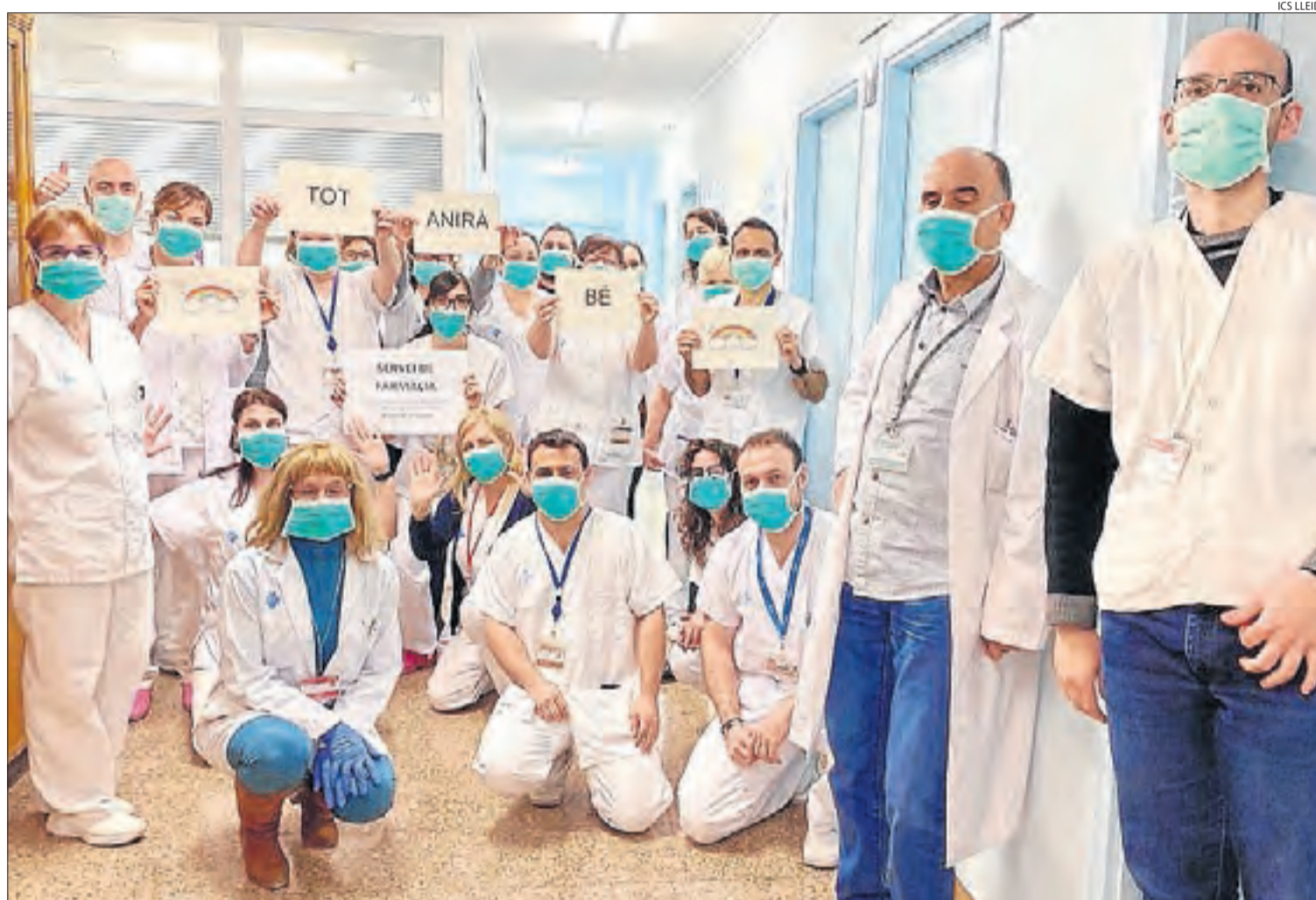
Professionals del servei de Farmàcia Hospitalària de l'Arnau es van fer una foto per donar ànims a la població.

Un total de 65 persones estan hospitalitzades i nou es troben greus a l'UCI || Ja són tres els pacients que han estat donats d'alta, mentre que més de 150 professionals sanitaris estan confinats