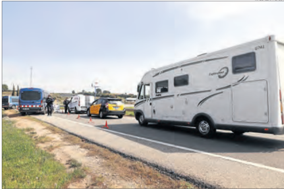
Un taxi de Barcelona i una autocaravana, ahir en el control de l'A-2 entre Lleida i Alcarràs.

Dijous a la nit, per exemple, van multar un ciutadà durant un control de documentació al carrer Penedès, al barri de Balàfia. A banda de denunciar-lo per saltar-se el confinament, també li van obrir un expedient al tro-