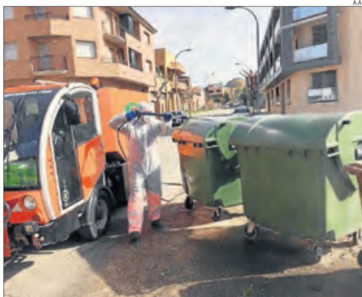
Neteja de contenidors als carrers d'Almacelles.

LLEIDA | Els consells comarcals esperen les targetes menjador per als nens becats i, d'aquesta forma, assegurar que els arribi el menjar a les cases. Compten amb tenir-les aquest dilluns.