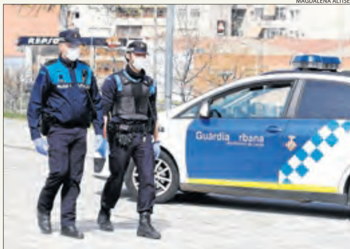
Agents de la Urbana patrullant amb màscara.