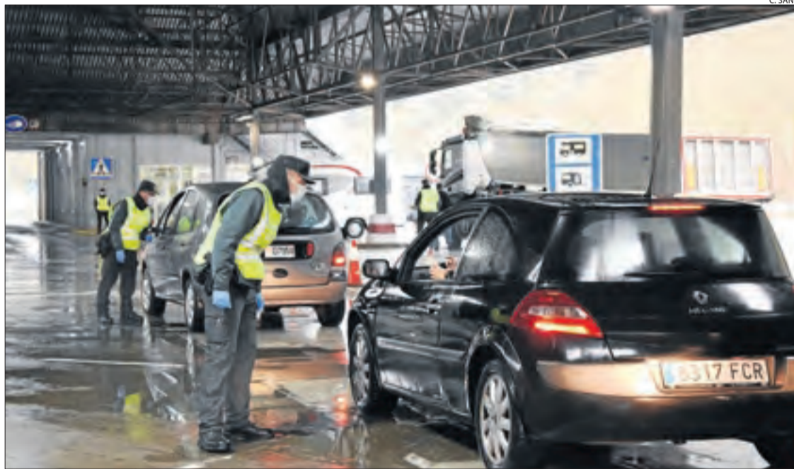
La duana espanyola a la Farga de Moles, on la Guàrdia Civil es protegia amb màscares.