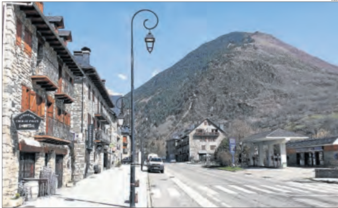
El poble de Barruera, ahir totalment buit de turistes i veïns.

D'altra banda, FGC reestructura avui el servei de trens a la línia Lleida-la Pobla, i els redueix a la meitat. Quant al comportament de la demanda, des de la setmana passada l'evolució ha anat a la baixa, i s'ha arribat a un 83% menys de passatgers. Es preveu que entre les estacions de Lleida i Balaguer circulin el 50% dels trens i entre les estacions de Balaguer i la Pobla ho facin la meitat dels autobusos habituals, ja que en aquest últim tram no es pot fer amb tren.