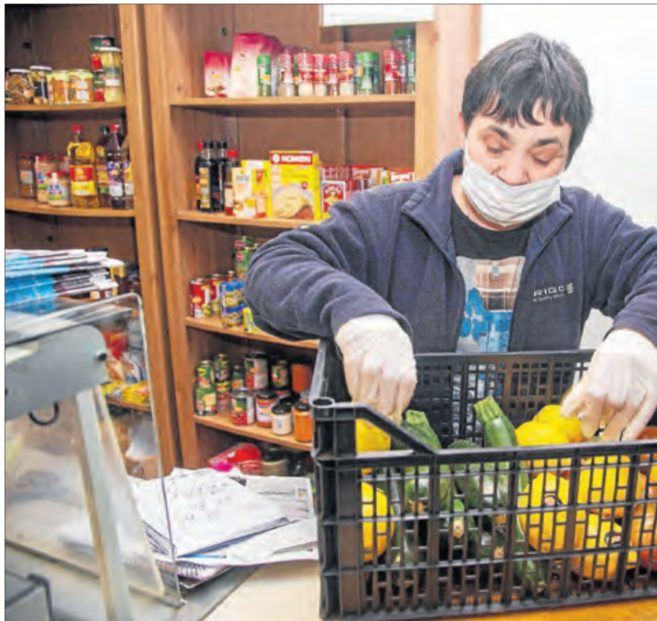
L'encarregada de l'única botiga de Nalec preparant una de les caixes de menjar que repartirà a domicili, segons indica

Al pla, Nalec és un dels municipis amb menys veïns. Una de les decisions que ha pres l'alcalde, Agnès Corbella, davant la crisi sanitària és demanar a l'única botiga del poble que atengui les comandes a domicili. Corbella manté contacte amb tots els veïns per poder assegurar-se que estan bé (vegeu la pàgina 11).