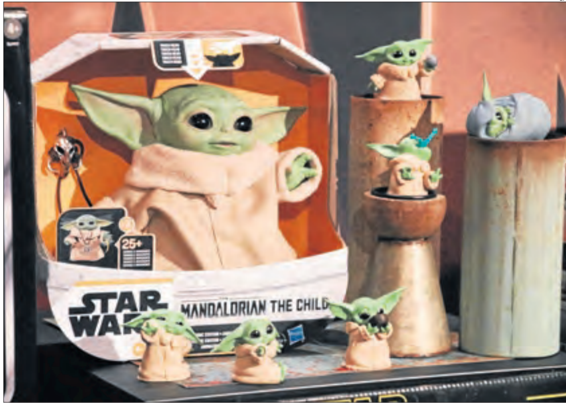
Productes de Baby Yoda, personatge de 'The Mandalorian' que ha captivat els fidels de la saga.

els clàssics de Disney i Pixar per entretenir tota la família, especialment els més petits, amb un desplegament de grans èxits com Frozen , La sirenita , El rey León , El libro de la selva , Cenicienta , Toy story , Up , Buscando a Nemo , Coco o Del revés , entre altres títols.