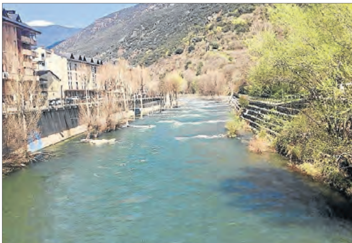
Imatge del riu Noguera Pallaresa al seu pas per Sort ahir, sense cap barca.