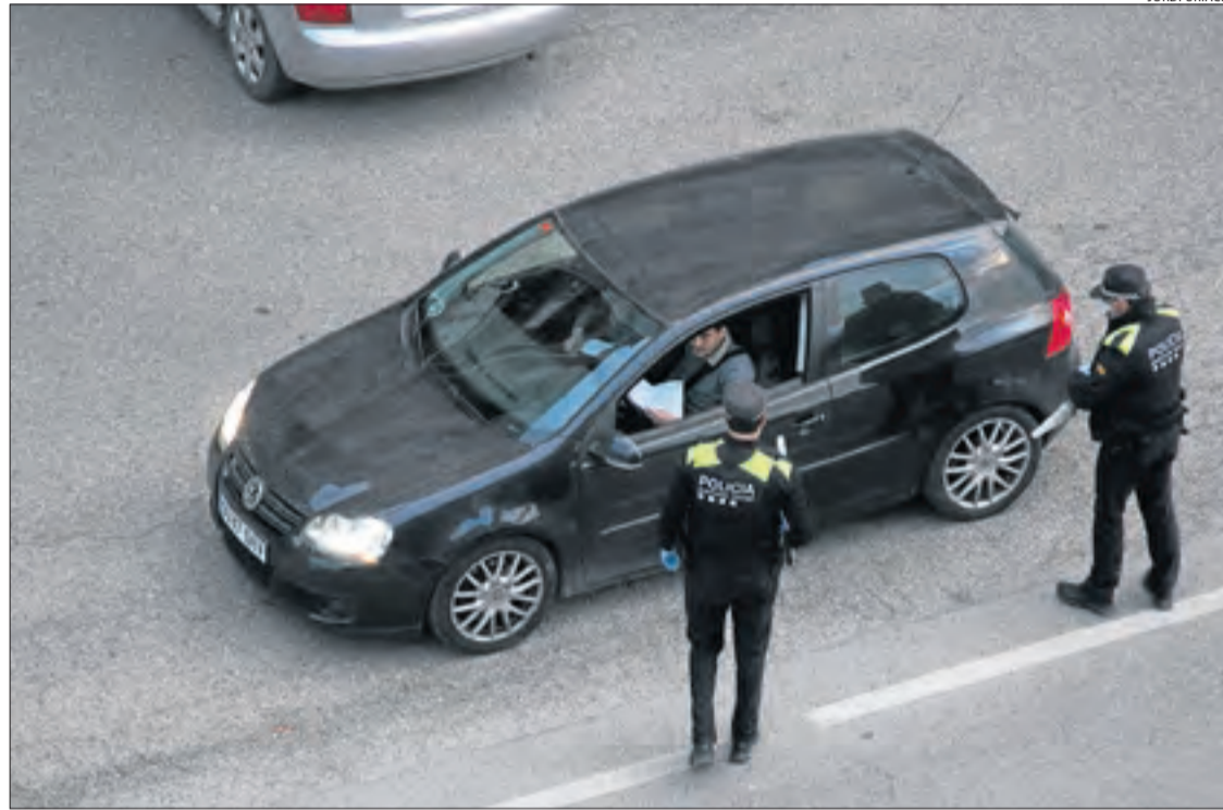
Imatge d'un control de la Policia Local de Tremp dilluns a última hora de la tarda.

D'aquesta forma, en tot just una setmana, els Mossos i la