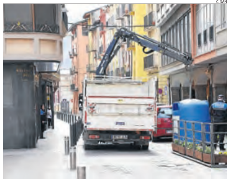
La Mancomunitat ha instal·lat més contenidors.

La MIGRAUM avança dos hores l'acabament de la jornada i desinfecta cada setmana els contenidors