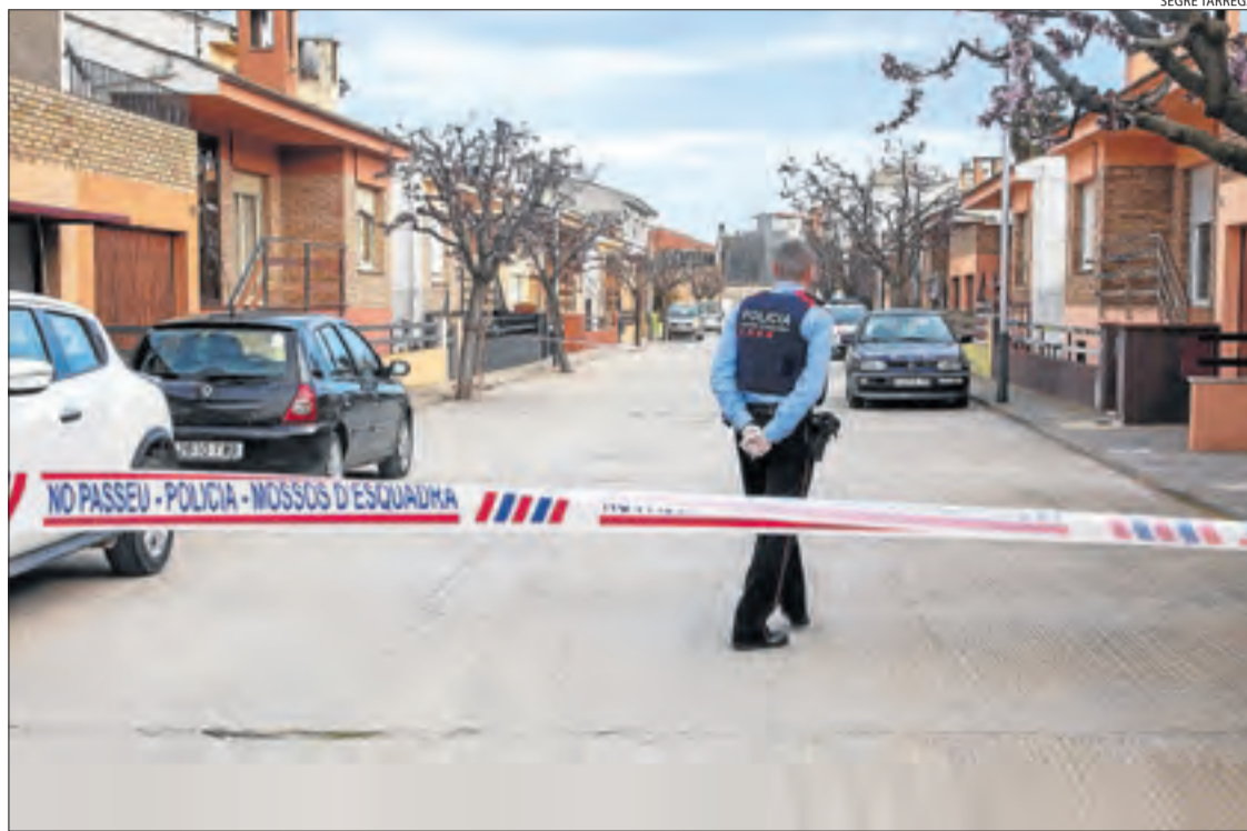
Imatge del cordó policial que van fer els Mossos d'Esquadra el 8 de març passat a Castellserà.

Proves posteriors van descartar el 8 de març que ella fos portadora del coronavirus. En canvi, sí que ho van detectar en la veïna que va morir finalment dilluns passat. L'última