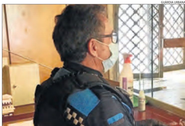
Un agent de la Urbana amb mascareta i gel desinfectant.

Per altra banda, el conseller Miquel Buch va assegurar que el Govern català no ha rebutjat cap tipus d'ajuda de l'Exèrcit per afrontar la crisi del coronavirus, entre altres coses perquè també el paguen els catalans: "Si el necessitem, ja el cridarem." No obstant, va puntualitzar que la Generalitat té des de fa més de vint anys un sistema propi d'emergències i seguretat i va indicar que si no han demanat l'ajuda de l'Exèrcit fins ara ha estat per no "absorbir" el suport de l'Estat cap a altres autonomies que no tenen aquest tipus de competències.