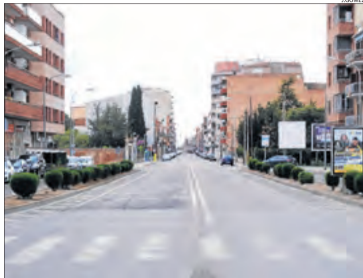
El carrer Ferrer i Busquets de Mollerussa, sense cotxes circulant.