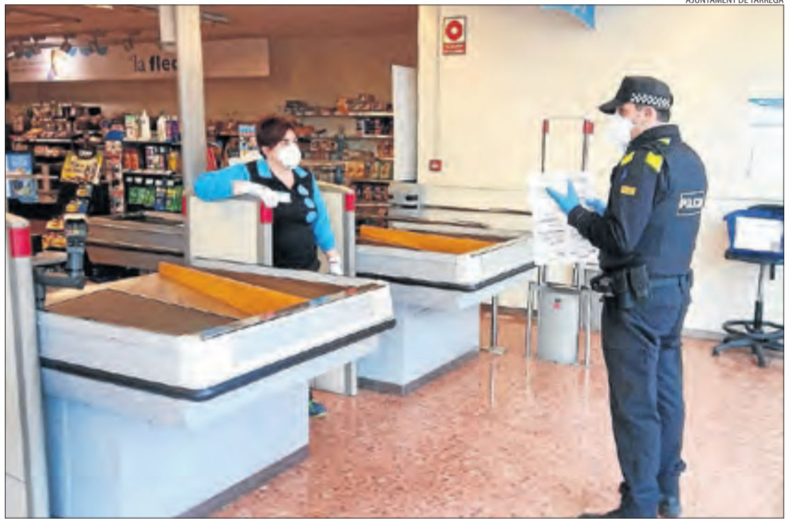
Un agent de la Policia Local de Tàrrrega entregant ahir un dels cartells de l'ICD en un comerç.

Una de les mesures en marxa en els últims dies per donar suport a les dones maltractades és