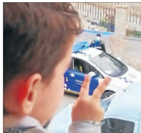
L'Àxel va cantar l'"Anys i anys", malgrat tot.

Més que la Xina || Espanya, amb 3.642 morts, supera el país asiàtic, amb Madrid al capdavant