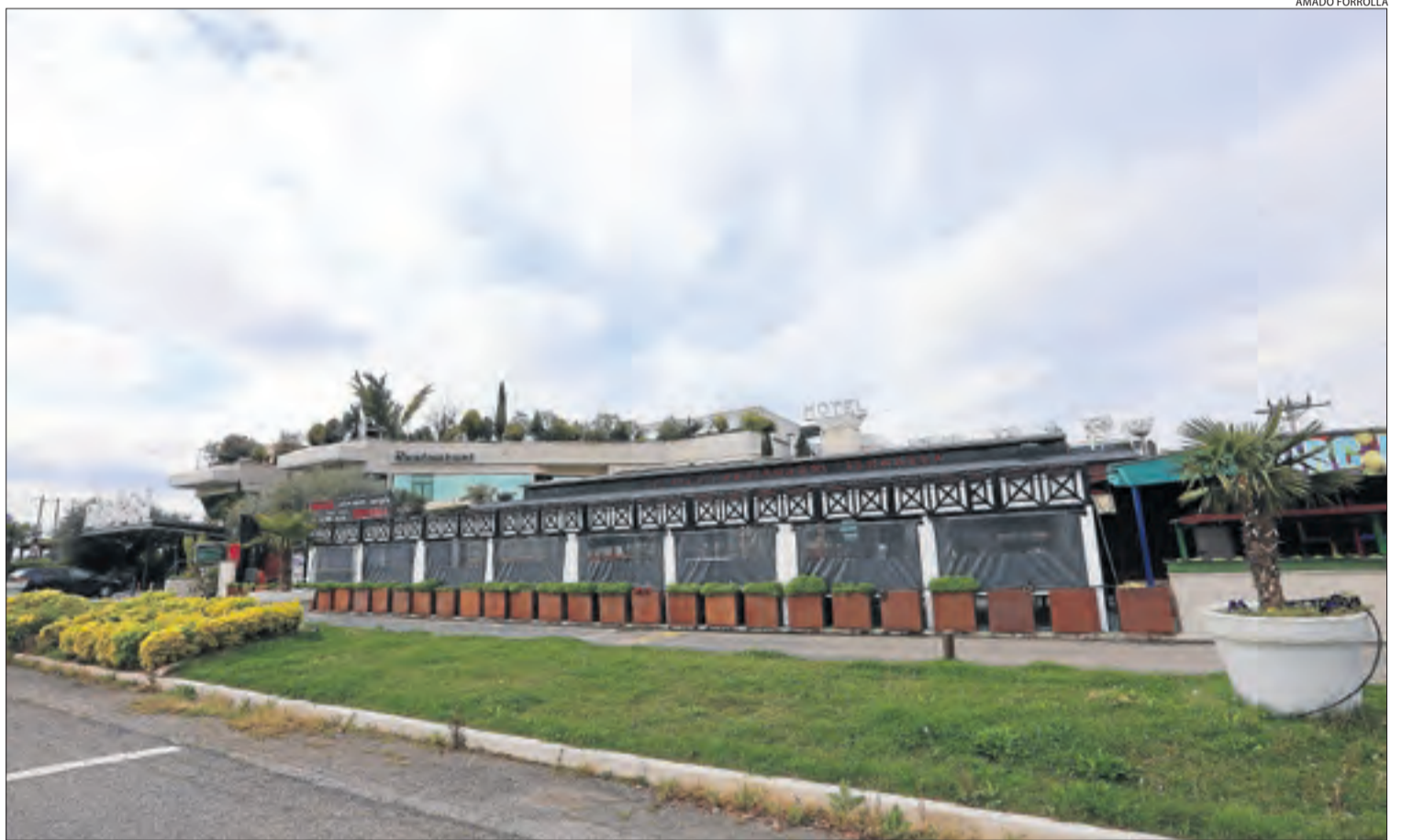
Vista de l'exterior de l'Hotel Nastasi, al complex hotelier de La Fonda situat al peu de la carretera d'Osca.

Salut també ha demanat els ajuntaments de totes les capitals de comarca que detallin els hotels que podrien acollir malalts. Dilluns passat, l'Hotel Alegret, a Tremp, va ser el primer que va començar a rebre'ls, en aquest cas no infectats pel Covid-19, sinó persones d'avançada edat que estaven ingressades a la unitat socio sanitària de l'hospital del Pallars.