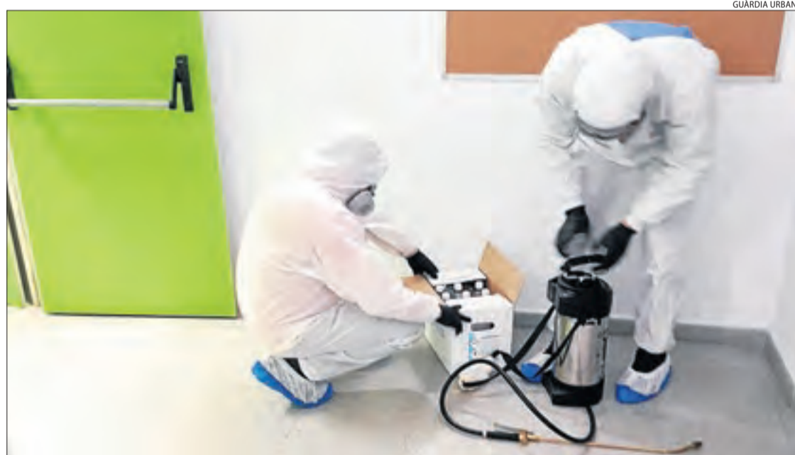
Treballs de desinfecció durant el dia d'ahir a les dependències de la comissaria de la Urbana.

amb totes les mesures de seguretat necessàries des de l'inici de la crisi sanitària, malgrat que alguns sindicats policials van denunciar la falta de material. Sobre això, la Paeria va assenyalar ahir que tots els efectius de la Guàrdia Urbana compten amb mascaretes, guants i gel hidroalcohòlic per a les mans