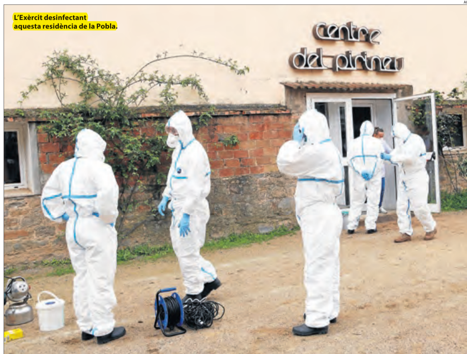
L'Exèrcit desinfectant aquesta residència de la Pobla.

Contagis || Es disparen a tot Lleida i l'Exèrcit desinfecta una residència de la Pobla