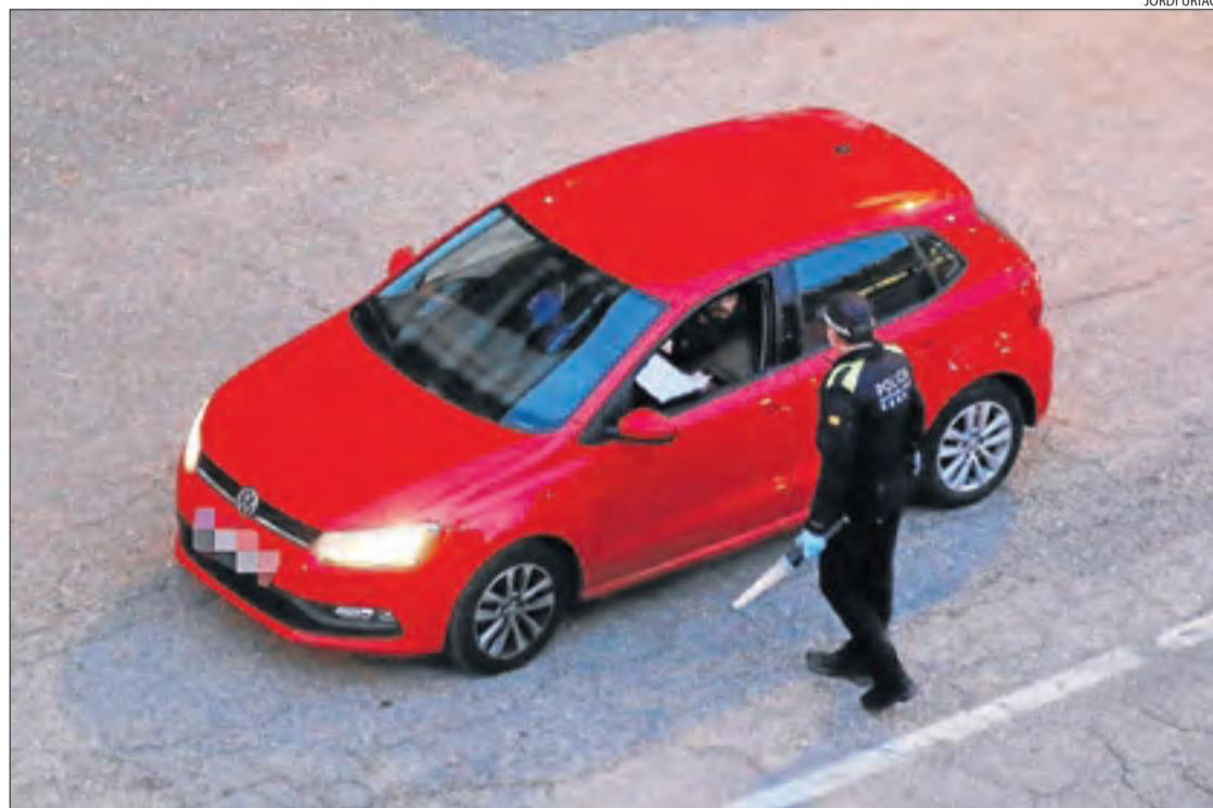
Imatge d'un control, dilluns passat, de la Policia Local de Tremp.

En el cas de la Urbana, els agents de la capital del Segrià van sancionar 41 persones que durant la jornada de dimarts van incomplir l'ordre de confinament. També es va sancionar el responsable d'un establiment situat a l'avinguda Blondel. L'actuació es va dur a terme quan una patrulla va comprovar que sortien del local clients que portaven cafès per endur i que tres persones es quedaven al carrer fent la consumició. Els agents van denunciar el responsable