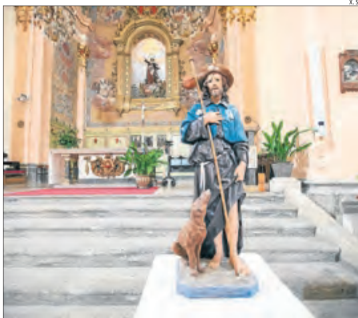
La imatge de Sant Roc, a la col·legiata de Santa Maria.

Per la seua part, l'Ateneu d'aquesta localitat de la Segarra ha traslladat l'escultura de Sant Roc, patró de les pestes, fins a la col·legiata de Santa Maria. Està col·locat davant l'altar major. Es tracta de l'escultura que presideix des de