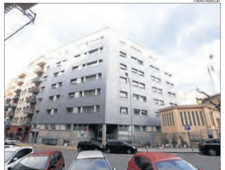
Imatge de la façana de l'hospital Nadal Meroles.

Santa Maria que també estiguin a punt de morir, deixaran que la família els visiti. Salut va destacar que "a Lleida tenim els espais i recursos disponibles per gestionar de forma correcta aquesta situació que estem vivint i s'activaran tots els recursos que siguin necessaris per gestionar aquest episodi i oferir la millor atenció a la ciutadania". De fet, està previst traslladar pacients a l'hotel Nastasi, que va oferir les seues instal·lacions.