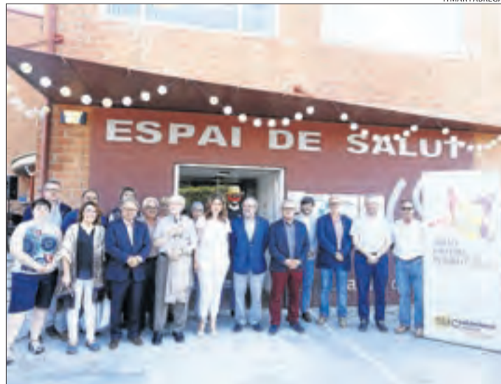
Inauguració de la seu de Salut Mental Ponent el 2018.

En aquest sentit, des de la coordinadora afirmen que, seguint les instruccions del departament de Treball, Afers Socials i Famílies, els serveis que continuen en funcionament són les llars de suport, els programes d'acompanyament integral en el procés de rehabilitació de persones amb trastorns mentals i el programa de suport a l'autonomia a la mateixa llar. A més, l'atenció, informació i assessorament a famílies i el servei d'ajuda psicològica a través del telèfon, correu electrònic o videoconferència també continuen funcionant. Per contra, els serveis que han quedat temporalment suspesos són els clubs socials i els prelaborals, encara que els professionals segueixen