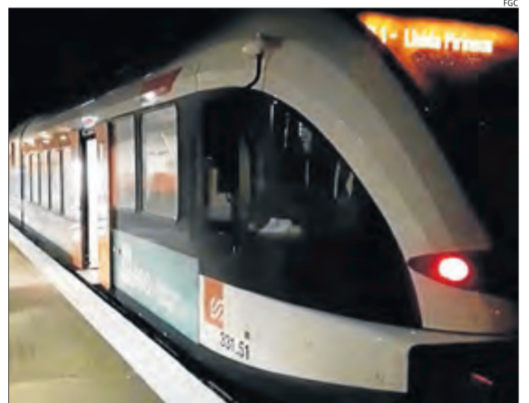
El tren de la Poble, fent sonar el xiulet a Balaguer.

de les xarxes socials. Així, diumenge passat va oficiar una missa en streaming per Facebook. Sigui mitjançant megafonia o a través de les xarxes socials, aquests i altres mossens busquen la manera d'exercir mentre la crisi sanitària limita les celebracions religioses per evitar possibles contagis.