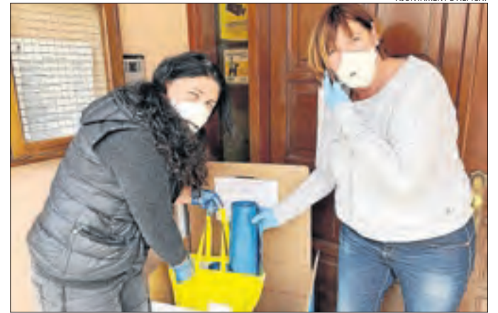
Voluntàries del grup Quiets a Casa! d'Alpicat.