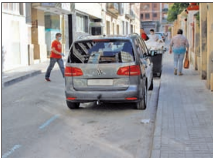
Els veïns es queixen de l'estretor del Carrer de la Premsa