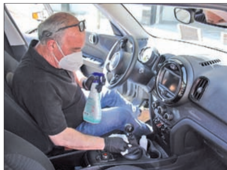
Es desinfecta el vehicle abans de començar la classe