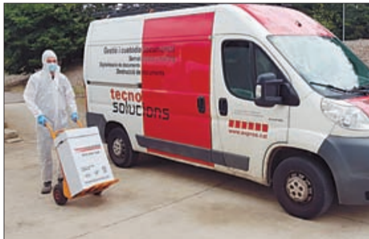
Un operari de Tecnosoluciones preparant la recollida d'EPI

El servei, que servirà per recollir els EPI dels residus comercials, s'inicia en el moment que l'usuari deixa el material en una caps de