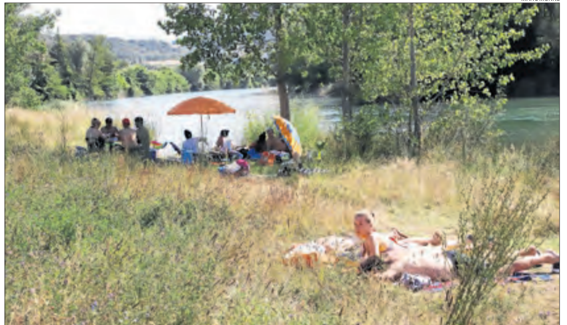
Alguns dels visitants que van anar ahir al parc al costat del riu Segre a Camarasa.