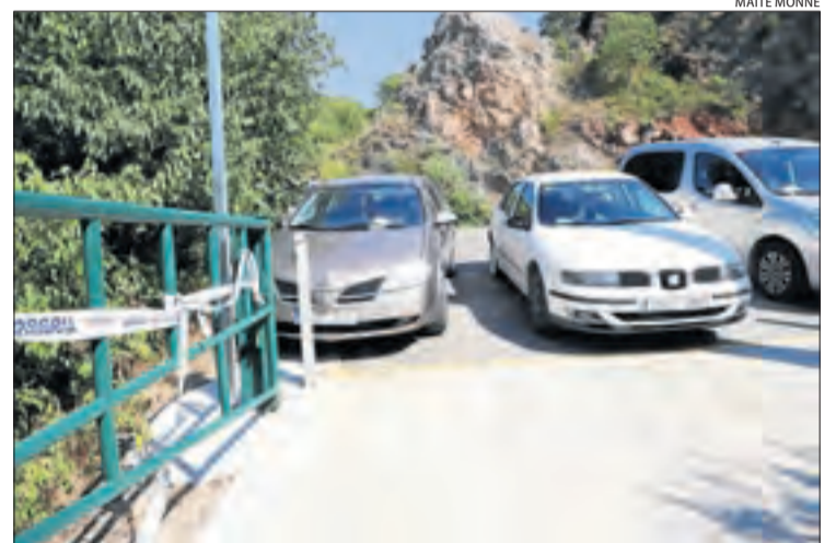
Cotxes multats per obstruir el pas a Camarasa.