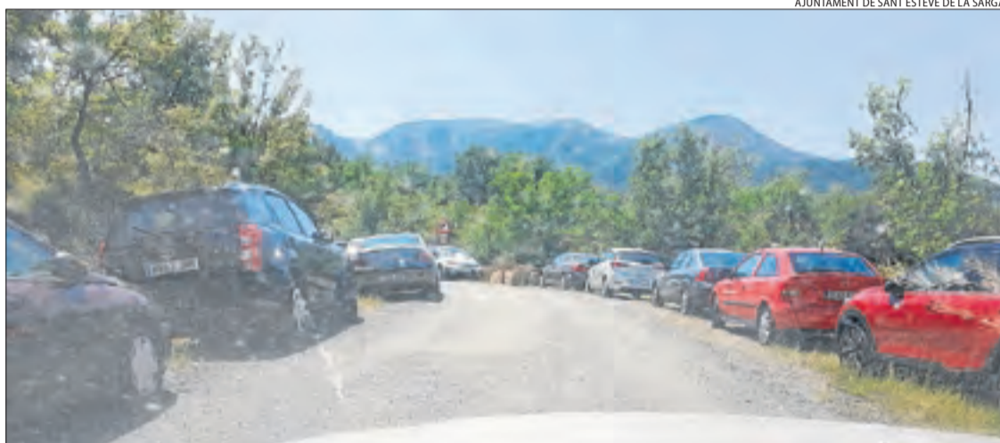
Els marges de la carretera d'accés a Mont-rebei, plens de cotxes.

A la Platgeta de Camarasa i Mont-rebei, espais a l'espera de regular l'aforament