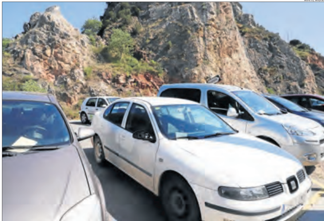
Diversos cotxes multats pels Mossos a Camarasa per estacionar en llocs prohibits.

Sensesostre || La Paeria paga uns dies l'hotel al no cabre als pavellons