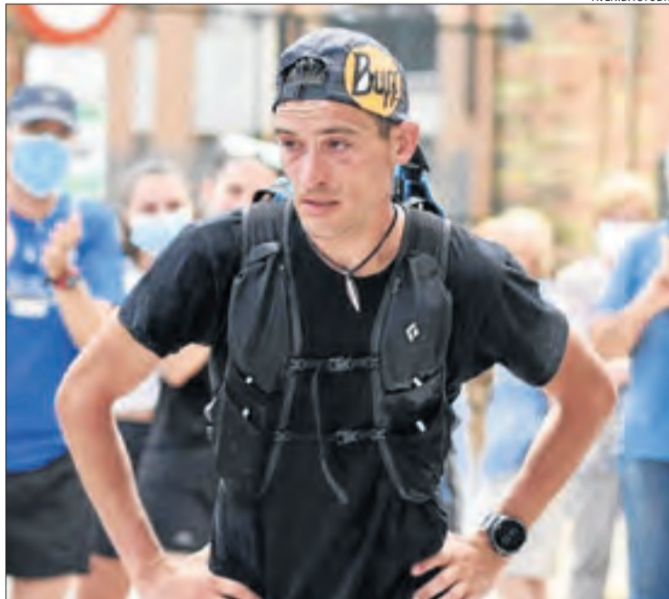
L'atleta, notablement cansat després de l'esforç.