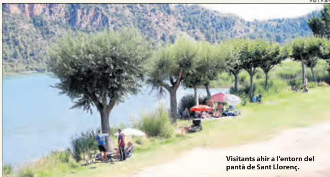
Visitants ahir a l'entorn del pantà de Sant Llorenç.