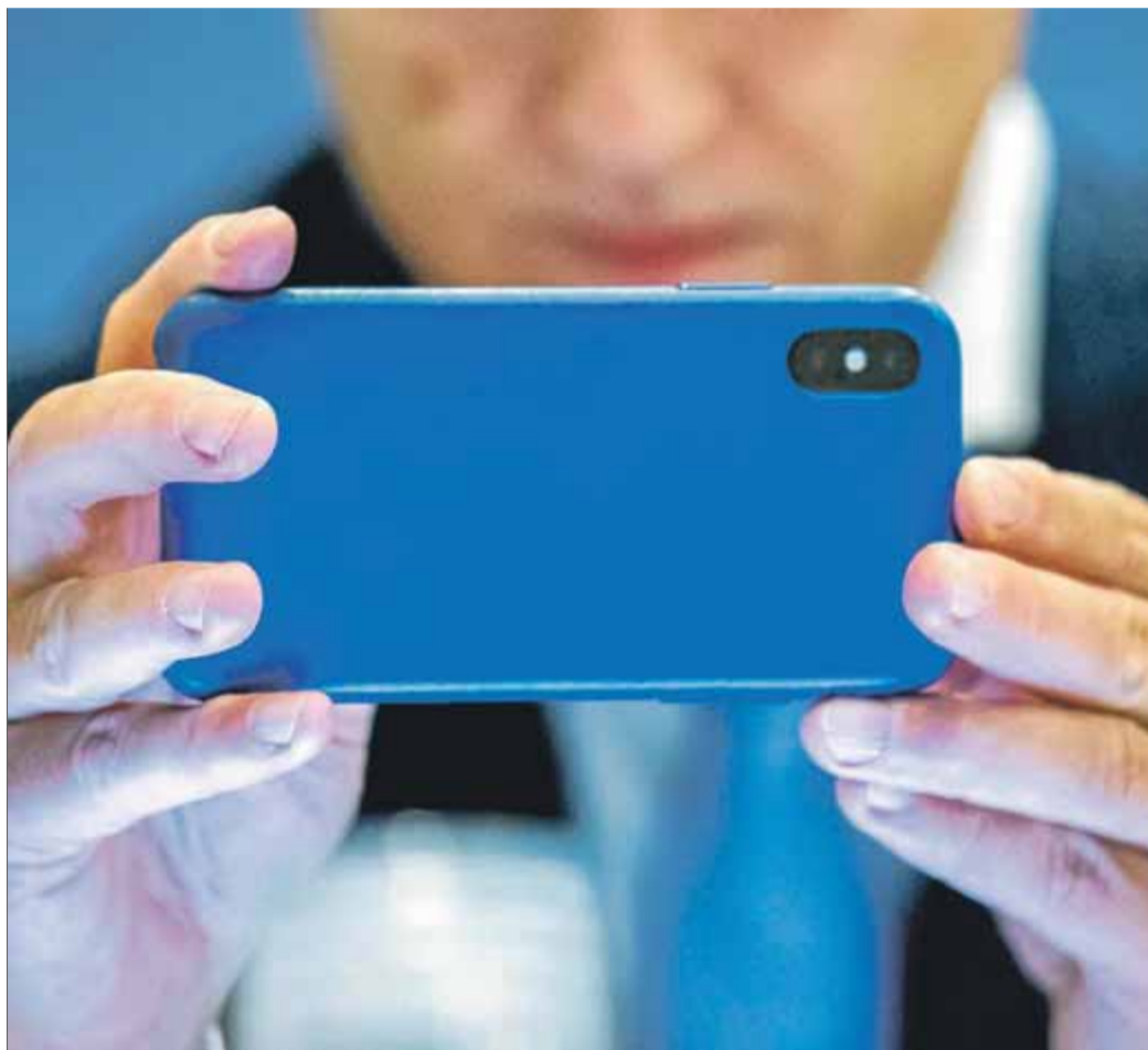
Els atacs al mòbil solen comptar sempre amb l'ajuda involuntària de l'usuari

Atès que aquestes vulnerabilitats són una amenaça greu per a la seguretat i privacitat de les dades dels usuaris i, de retruc, també poden comprometre greument la reputació de les empreses que els proporcionen el maquinari i el programari, les grans firmes del sector tecnològic ofereixen compensa-