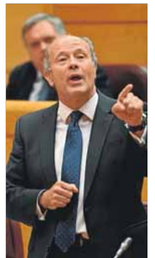
Campo en una imatge d'arxiu

cions il·legals d'espionatge als mòbils dels dirigents catalans. Campo va refermar la seva confiança en l'estat de dret i va posar com a exemple el fet que les operacions del Centro Nacional de Intel·ligència (CNI) estiguin supervisades per magistrats del Tribunal Suprem. Qui no ha fet cap declaració des de l'esclat del cas és la ministra de Defensa, Margarita Robles, de la qual depèn el CNI. El president del Parlament, Roger Torrent, va anunciar que contactaria amb ella per demanar-li explicacions. ■