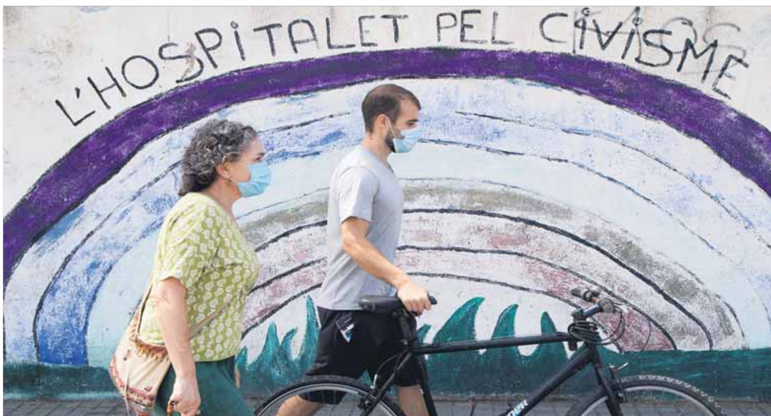
Dos ciutadans, ahir, amb la mascareta posada, caminant per un carrer de l'Hospitalet, on s'han endurit les mesures sanitàries ■ ORIOL DURAN

CAUSA • L'Estat hauria comprat el programari per a l'operació Catalunya