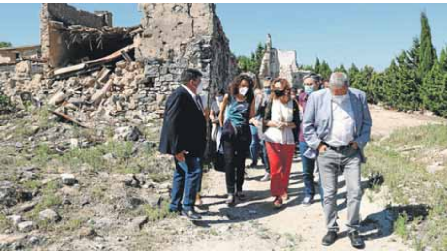
La visita d'ahir de les autoritats al Poble Vell de Corbera