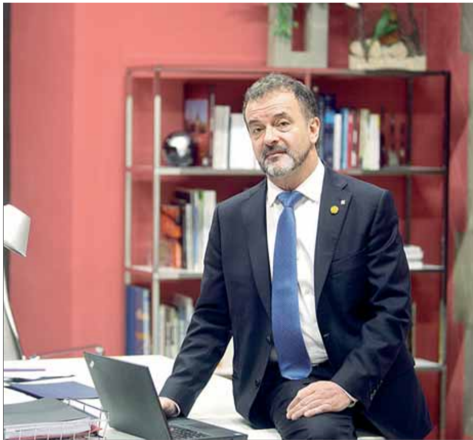
Alfred Bosch en una imatge de quan era conseller d'Acció Exterior de la Generalitat