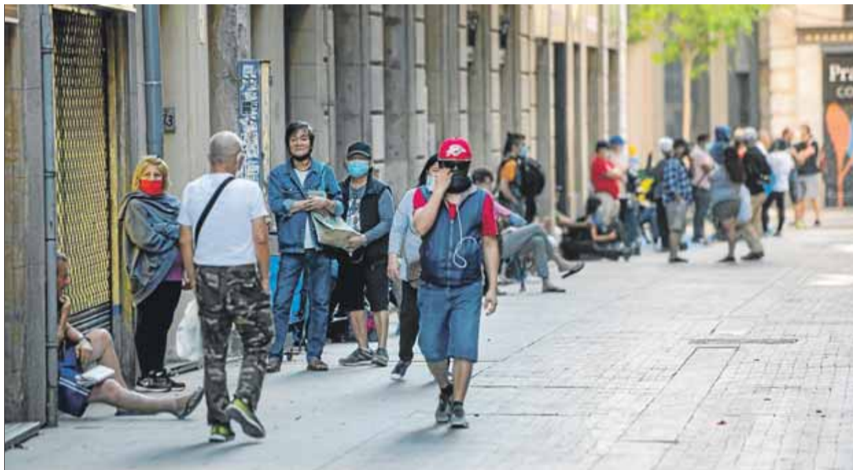
Cua per rebre aliments de la parròquia de Santa Anna de Barcelona, al Portal de l'Àngel