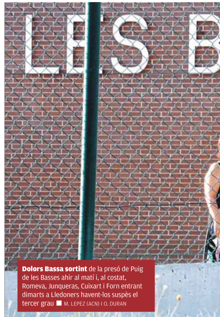
Dolors Bassa sortint de la presó de Puig de les Basses ahir al matí i, al costat, Romeva, Junqueras, Cuixart i Forn entrant dimarts a Lledoners havent-los suspès el tercer grau

La fiscalia ja advertia dimarts que apel·laria al Suprem en el cas que hagués de recórrer contra una decisió del jutjat contrària a suspendre el règim de tercer grau, que no li va fer falta perquè es va acabar aplicant, i ara s'espera que en