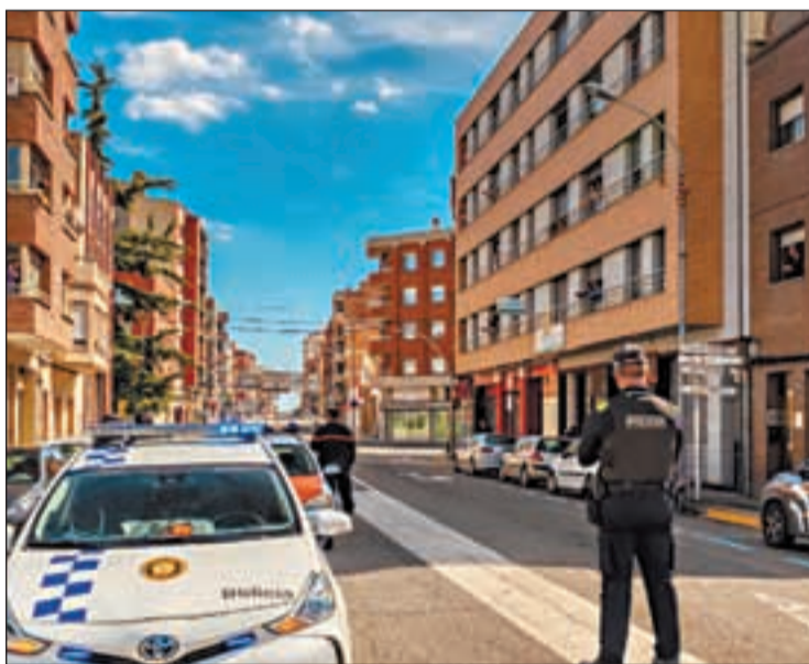
FOTO: Quim Rafel (Aj. Mollerussa) / La Policia Local de Mollerussa

També s'obriran els jocs infantils de les zones d'esbarjo, que fins ara havien tingut l'ús prohibit.