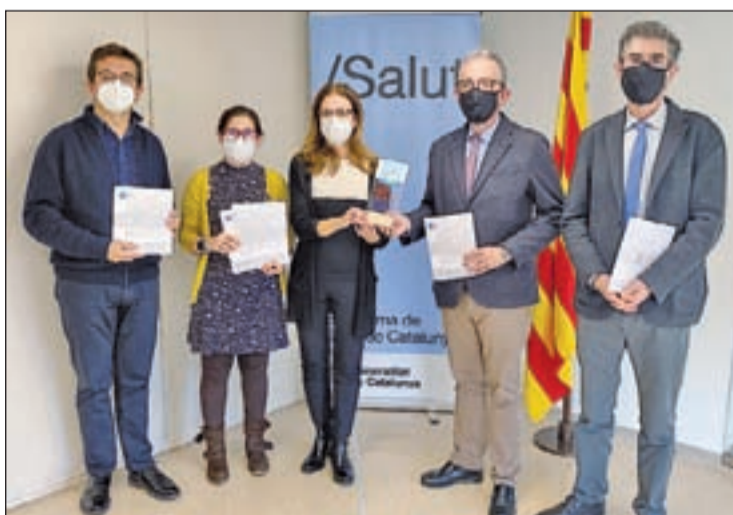
El guardó reconeix el seu "esforç" i "compromís"

Farreny també va explicar que fer-se la prova "no protegeix" i va instar la població a continuar prenent i respectant les mesures