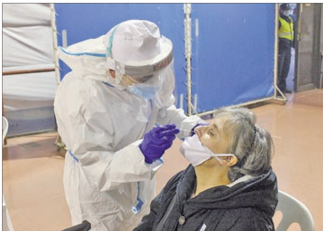
Un sanitari fent un test ràpid d'antígens a una dona al pavelló Onze de Setembre