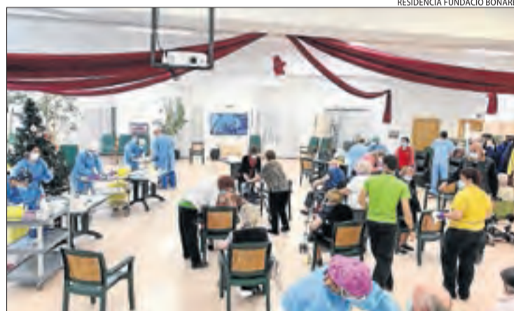
El cribatge del 31 a la residència Fundació BonÀrea de Guissona.

D'altra banda, el passat dia 31 va continuar l'administració de vacunes de Pfizer-BioNTech en residències de Guissona, Alcaràs i una de Lleida al pla, així com en dos de la Seu d'Urgell al Pirineu. La vacunació seguirà la setmana que ve.