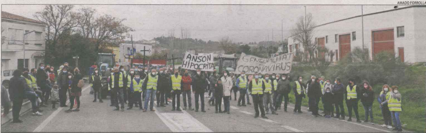
AFFECTATS PEL TEMPORAL FILOMENA TALLEN LA C-12 PER EXIGIR AJUTS