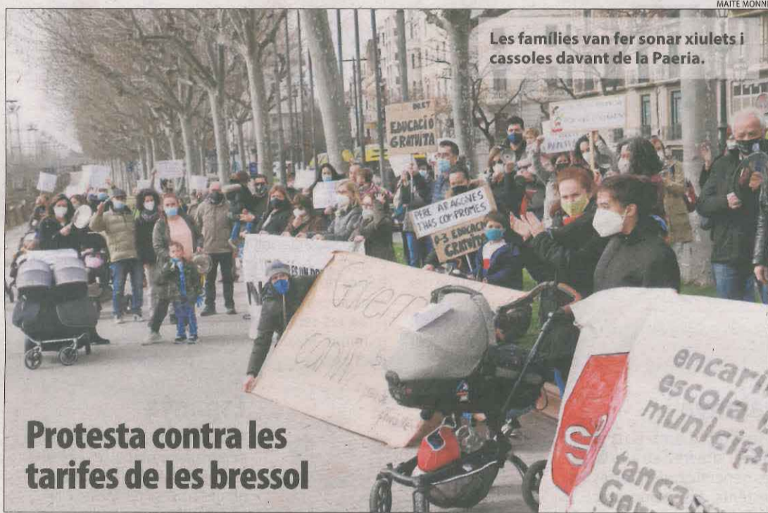
Protesta contra les tarifes de les bressol

Un informe de l'àrea d'Educació de la Paeria sobre la segregació escolar a la ciutat reflecteix que una dotzena dels 38 centres de la ciutat, els qualificats d'alta complexitat, escolaritzen la meitat dels alumnes de famílies amb menys recursos o nous de l'estranger. La pública assumeix el gruix d'aquests nens, però hi ha un gran desequilibri entre els seus col·legis, igual que a la concertada.