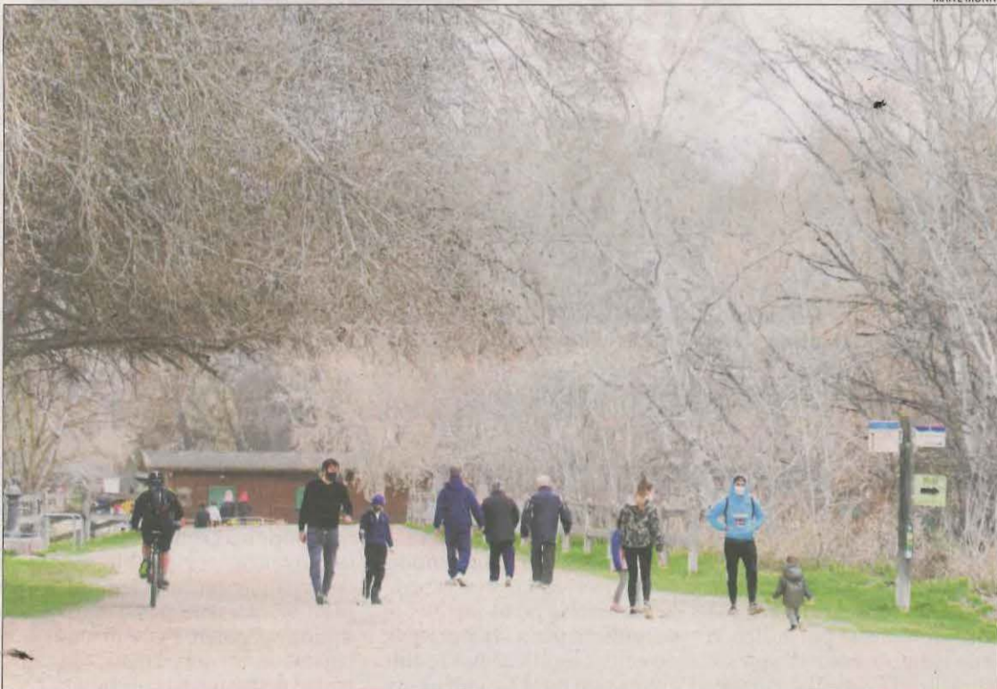
Diverses persones passejant en família o fent exercici ahir al parc de la Mitjana de Lleida.

S'ha de recordar que aquest és un indicador que es basa en el nombre de casos i el total de