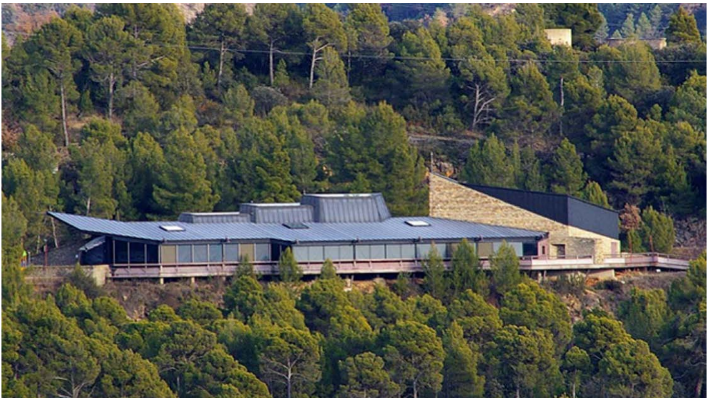
L'edifici CITA.

TREMP El Consell Comarcal del Pallars Jussà ha ofert cedir espais de l'edifici del CITA -entre Talarn i Salàs- per a la implantació dels serveis territorials de la Generalitat al territori. Tot plegat s'emmarca en la moció aprovada per unanimitat en el ple d'aquest dimarts on es demana el desplegament immediat dels serveis territorials de la Generalitat a la vegueria de l'Alt Pirineu i Aran, igual que passa a la resta de territoris. L'objectiu, s'assenyala, és "afrontar amb majors garanties el desenvolupament integral de les seves comarques tot garantint inversions