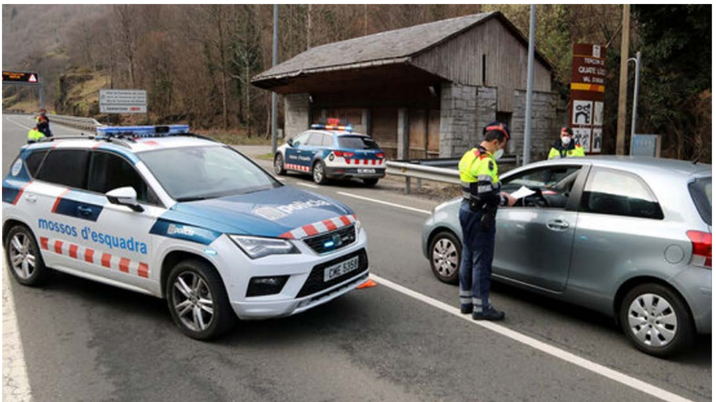
Control policial a la frontera entre França i l'Aran