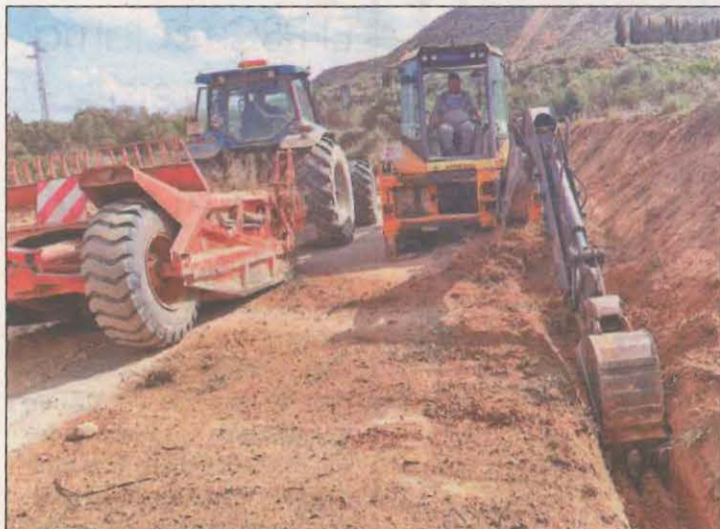
Els treballs s'estan duent a terme al polígon 15