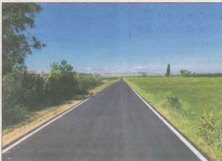
Les obres s'han completat aquests primers dies de maig

ció del Camí de la Mariola, que uneix l'àrea amb Santa Maria de Gimènells i es regenerarà de manera integral aquesta primavera amb fons de la Confederació Hidrogràfica de l'Ebre aconseguits en una negociació que es va tancar l'any passat i posa fi a un greuge d'anys. Els treballs que s'han completat al Camí del km 7 han comportat una inversió de 121.000 euros.