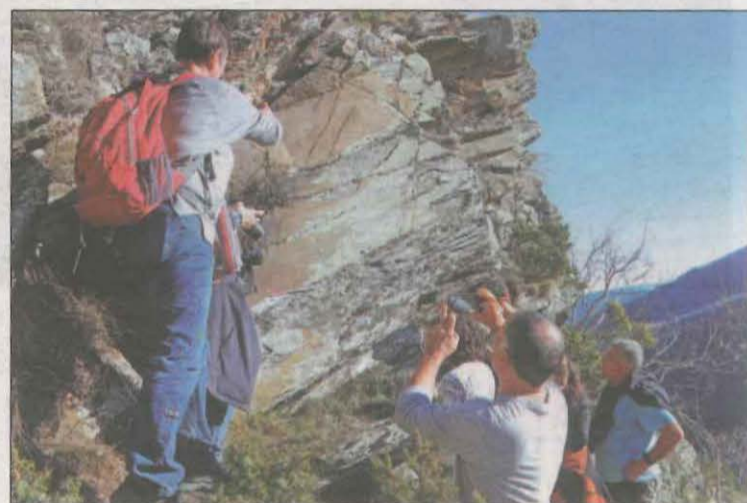
Un grup de veïns observen les roques on hi ha els gravats

Paral·lelament, la Direcció General del Patrimoni Cultural en tramitarà una zona de protecció per protegir també l'entorn natural que envolta aquesta zona arqueològica, i garantir la correcta contemplació d'aquests, així com