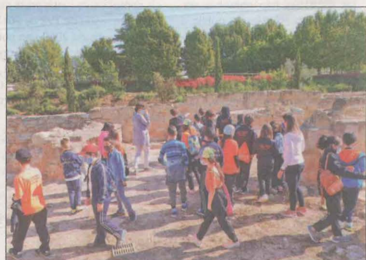
Són alumnes de l'escola Antònia Simó i Arnó

Els consells comarcals de l'Alt Pirineu i el Conselh Generau d'Aran demanen tenir més autonomia a l'hora de gestionar els serveis que es presten en aquests organismes. D'aquesta manera, consideren que des d'aquests ens es podrien tirar endavant polítiques específiques en funció de les necessitats o particularitats de cada territori. Aquest plantejament es va posar ahir damunt la taula en una nova reunió dels presidents d'aquestes institucions, que va tenir lloc a Puigcerdà.