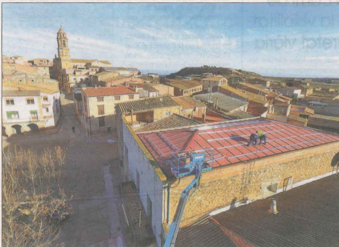
Imatge d'arxiu de Llardecans, un dels pobles escollits per participar a la prova pilot

Els projectes s'emmarquen dins una prova pilot de l'Agència de l'Habitatge de Catalunya per impulsar el parc d'habitatge de