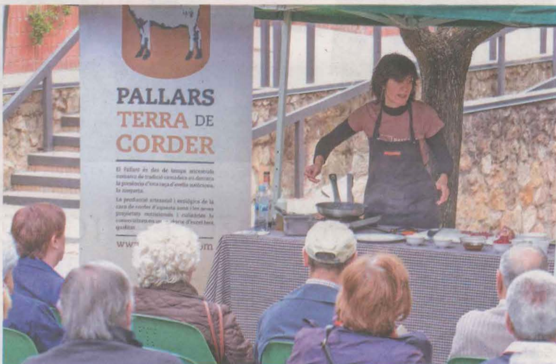
El municipi de Tremp tornarà a viure tot un seguit d'activitats relacionades amb el corder

Juntament, amb Obrador Xisqueta s'han organitzat dues activitats infantils: un taller de feltre mullat, al matí a la rambla de Dr. Pearson, i un conta-contes amb la tècnica japonesa Kamishibai del conte Xisca que tremoles? a