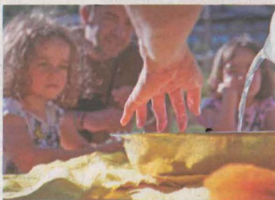
Carnisseries, bars i restaurants fan promoció de la carn de corder. A la dreta, un taller