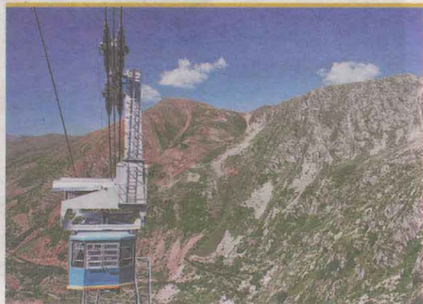
En la imatge telefèric de l'Estany Gento a la Vall Fosca (Oriol Clavera)

I ja que parlem de reconeixements i certificacions de qualitat, el Pallars Jussà en va plena. Cal recordar que la comarca atrapa una part del Parc Nacional d'Aiguestortes i Estany de Sant Maurici, que també és reserva i destinació turística Starlight des del 2018. Com ja hem dit, és Geoparc Mundial de la Unesco. Les falles de la Pobla de Segur, formen part del Patrimoni Cultural Immateral de la Humanitat per les festes del foc del solstici d'estiu dels Pirineus des del 2015 i, finalment, les pintures rupestres com l'home de Sant Gervàs, a la Balma de les Ovelles de la Terreta, són Patrimoni Mundial des de 1998, junt amb moltes altres mostres d'aquest art prehistòric de la zona mediterrània.