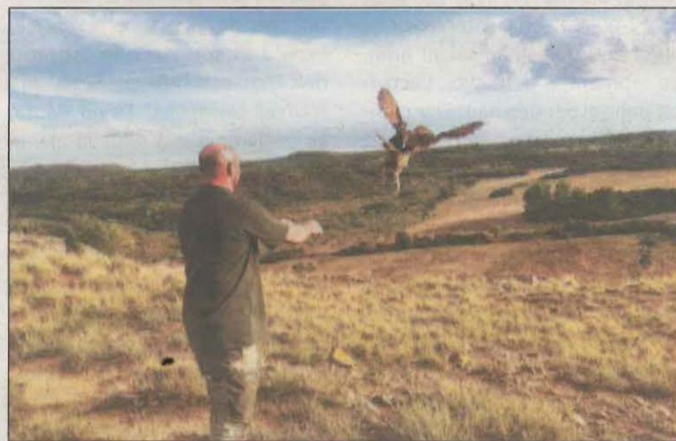
Moment de l'alliberament del duc a Mas de Melons

els pròxims mesos en diferents punts del país com és el cas del Baix Empordà, la Catalunya Central, la plana de Lleida i les Terres de l'Ebre. L'objectiu és seguir aquests rapinyaires durant un any per estudiar-ne el comportament i registrar dades i informació per tal de definir accions que contribueixin a preservar l'espècie.