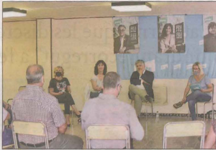
La reunió de treball de Junts a la demarcació de Lleida

Segons la formació van tractar temes com la candidatura de Catalunya als JJOO d'Hivern, que volen "garantir que sigui un èxit", o bé la reforma de la política agrària comuna i la millora de les infraestructures. "Ens cal estar atents a les demandes del territori per recollir les seves propostes i preocupacions i donar-hi resposta des del Parlament", va