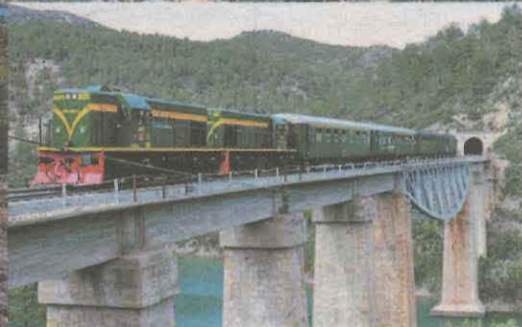
En la imatge de dalt la brama del cérvol a Boumort (Oriol Clavera), imatge familiar es poden veure les petjades dels dinosaures del Parc del Cretàcic (Oriol Clavera) i per últim el Tren dels Llacs (LM)