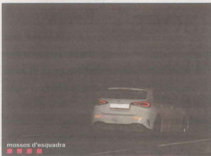
Imatge del vehicle enxampat a Menàrguens