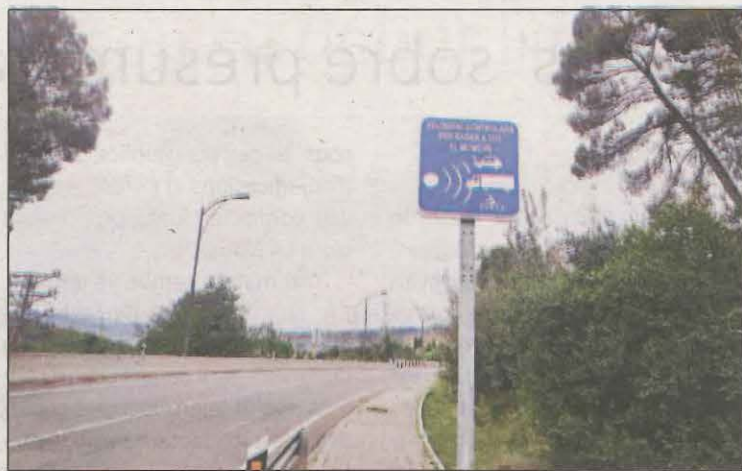
Un cartell alerta dels controls de velocitat

Malgrat que el límit de velocitat permesa en aquestes vies és de 50 km/h, el dispositiu fotografiava vehicles que superaven els 56 km/h. Del total de 523 fotografies a vehicles infractors són vàlides per a trametre 465, els conductors dels quals rebran la sanció. Pel que fa a les velocitats, el radar va detectar 173 cotxes que superaven els 60 km/h. D'aquests, 10 vehicles circulaven a més de 70 km/h i tres van pas-