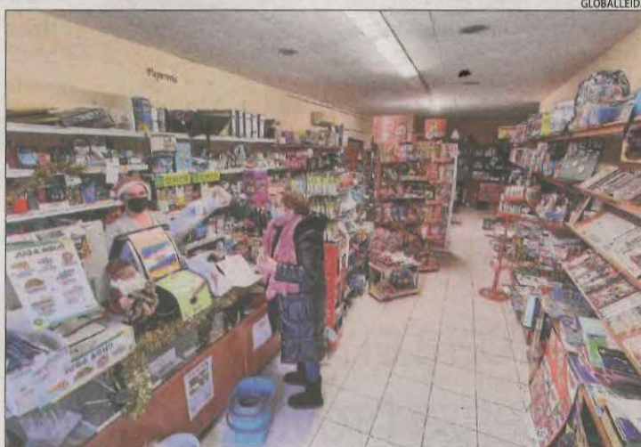
La papereria de Bellcaire que ha adquirit una nova empresària.