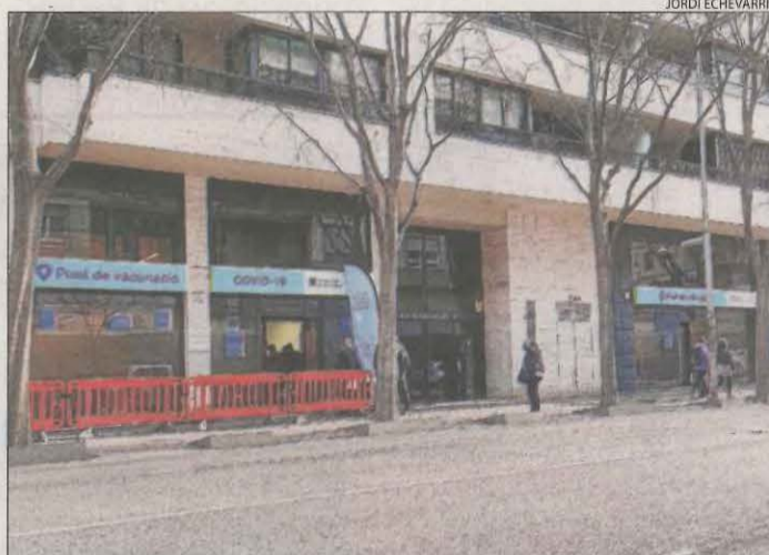
Imatge d'ahir del punt de vacunació de Lleida ciutat.

Per la seua part, fonts del ministeri de Sanitat van explicar que la mesura s'abordarà a la trobada d'avui si els consellers del ram traslladen la proposta, encara que van remarcar que la qüestió no està a l'ordre del dia. Si s'aprova aquesta proposta, suposaria fer un pas més en la direcció que la Comissió de Salut Pública va prendre la setmana passada amb l'eliminació de les quarantenes per als con-