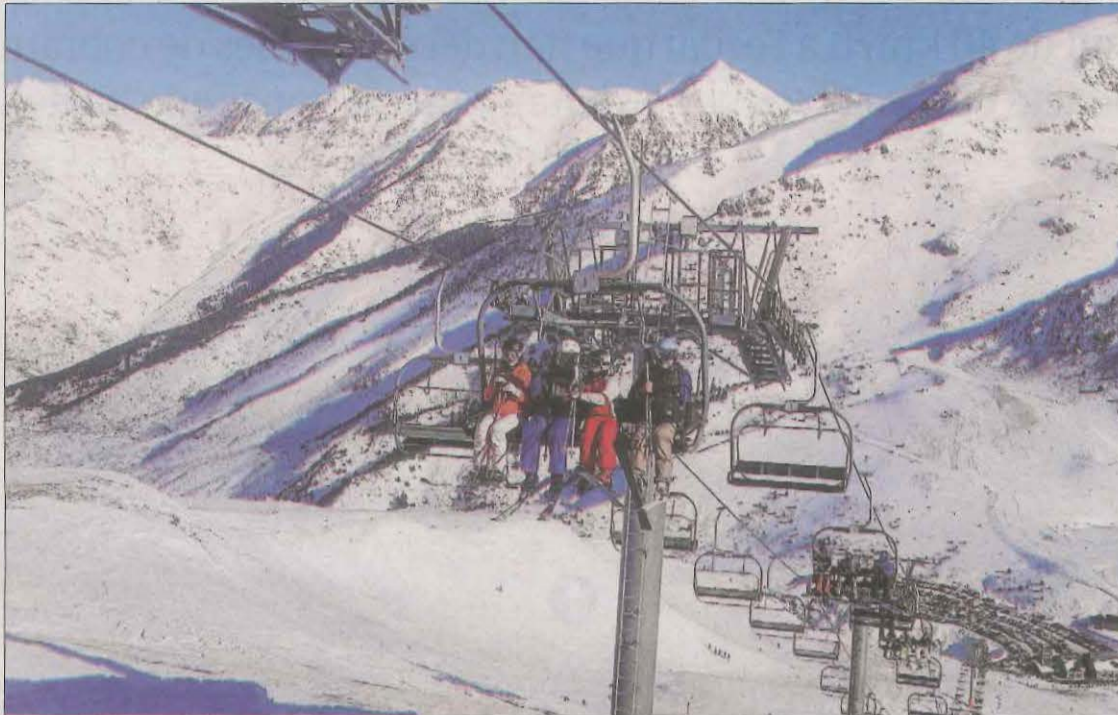
L'estació de Boí Taüll, un dels principals reclams turístics d'aquest hivern a l'Alta Ribagorça.