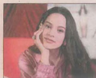
La cantant catalana Rosalía.