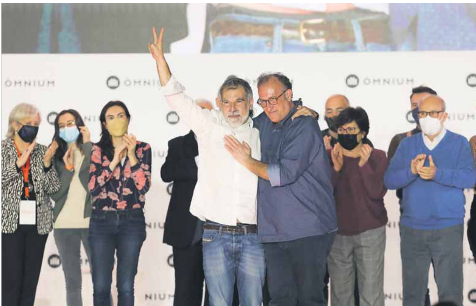
L'abraçada entre els dos líders d'Òmnium en el moment del relleu a la presidència, en l'acte que es va fer a la Farga de l'Hospitalet de Llobregat ■ ORIOL DURAN