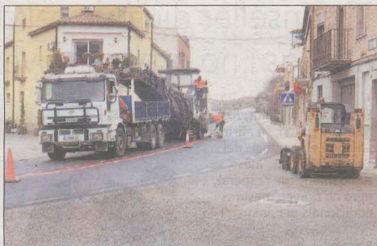
Les obres es fan a la corba que dona entrada al poble