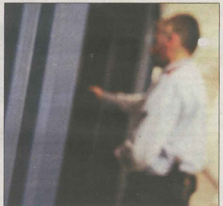
La policia va detenir la parella dilluns

Les mateixes fonts van indicar que en aquests moments, la policia catalana està fent les diligències corresponents sobre el succés. En la primera declaració,