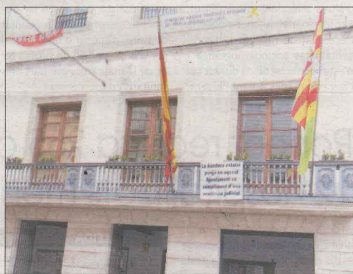
A banda de la bandera, s'ha penjat un cartell informatiu

redactat per la Diputació i va proposar al Ministeri de crear cinc nous accessos a l'AP-2 per "millorar la connexió directa a 24 municipis del Segrià i les Garrigues dels 49 de l'àrea d'influència".